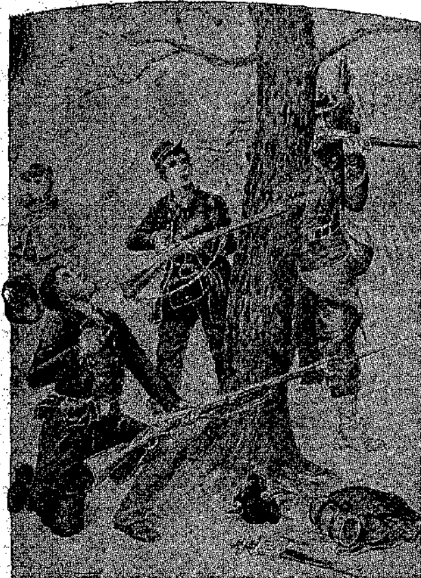
Ὁ καθηγητῆς ἀφίσε τὸ παιδί του νὰ πείσῃ... (Σελ. 10, στ. 6')

Κατὰπληξη — γιὰτὶ ξανάβρισκε τόσο ξαφνικὰ καὶ τόσο ἀναπάντεχα τὸν ἀξαφανισμένο