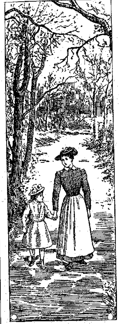
Και ο κούρ-Αντώνης φόρεσε τα γυαλιά του και, βιάζοντας άπό την τόση του το μέτρο, στάθηκε μπροστά στη Μαρίτσα και περίμενε να του άπατηθή. Η Μαρίτσα τότε βρέθηκε σε δύσκολη θέση και κοίταξε καλά-καλά τη νταντά της, ο να την ρωτούσε... (Ακολουθεί)