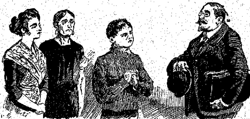
«Ὁ κύριος Δαζιᾶ, διπλόπλοος ἡγετὸς Ἀθημαρχίας...» (Σελ. 17, στ. α')

Πάντα σιωπηλός, ὁ Τροῦ-Τιέν πλησίασε μὲ τὸ εὐλύγιστο βῆμα του, ἔπιασε τὸ μπράτσο τοῦ παιδιοῦ σὲνα ὀρισμένο σημεῖο, τὴν ἔβριξε λιγάκι καὶ τόκαμε νὰ μουδιάσῃ καὶ νὰ πύσῃ ἀναίσθητο.