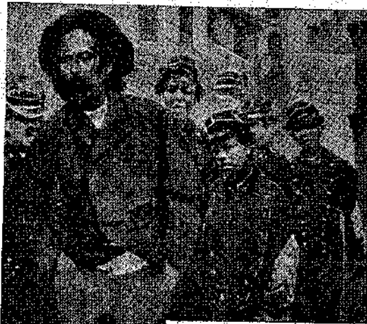
«Ένας ψηλός κι' αδύνατος, ακολουθούμενος από πέντε-έξη άραπάκια...» (Σελ. 24)

Εν' άπ' αυτά τα δρομάκια άνοιγόταν στον άριθμό 25 της λεωφόρου κι' όνομαζόταν «το στενό των Δώδεκα Σπιτιών». Στο άνοιγμα είχε μια μεγάλη καγκελόπορτα και, στέ άνώφλι της, χρυσά πομπώδη γράμματα έλεγαν ότι εκεί-μέσα βρισκόταν τό Γυμνάσιο Μορονβάλ. Άλλά μόλις περνούσες τό κατώφλι της, κατοόσες σέ μια βρώμερη μάυρη λάσπη, μπροστά σέ παλιόσπιτα που γκρέμιζαν, σέ γιατιά, σέ μάντρες ή σέ παράγκες από παλιοσάνια. Ο όχτηός στη μέση του στενού και τό πελαϊκό φανάρι του λαδιού με τόνάνταυγαστήρα, σέ γύριζαν πηνήγνα χρόνια πίσω,