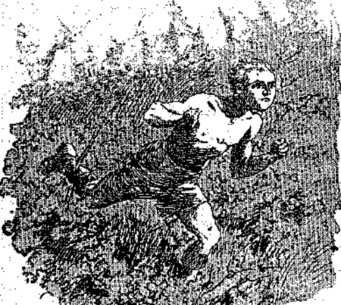
*Ὁ Φραγκίσκος ἔτρεξε δσο βαστοβαν τὰ πόδια του... (Σελ. 294, στ. γ')

ἰδέα, γι' αὐτὸ δὲν πρόσεξε καθόλου τὰ ὄρατα κτίρια καὶ τοὺς εὐρύχωρους δρόμους τῆς πόλεως. Μὰ πῶση ἀνακούριση εἶδε τοὺς Γάλλους στρατιώτες μὲ τὴν ἀσπρη κάσκα, ποῦ φρουροῦσαν μπρὸς στὴν πόλη τοῦ Κυβερνεῖου! Πέρασε τὸν κῆπο μὲ τὴν ὁρμή, ὥστε κανένας δὲ ἀκέφθηκε νὰ τὸν σταματήσει, καὶ