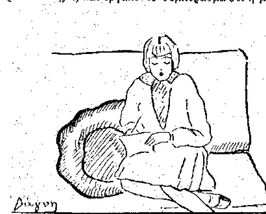
Η Δάγνη σκέπτεται ποιά είναι η μεγαλύτερη ετυχία... (Γυίτισο της ίδιας.)

πουμε το κατάντημα του κόσμου. Πάει παρακάτω και άκούει να λένε ότι μεγαλύτερη ετυχία είναι να μνη πεθαινη κανείς. Πάει παρακάτω (καλέ, σοστό παραμύθι κατανάσι αυτή η απάντησις του Σαρδανάπαλου) και άκούει: «δέν ήταν να πεθάνουμε όλοι;» Και ούτω καθέξής όσπου πείστηκε ο Σαρδανάπαλος ότι εκείνο που ο ένας θεωρεί γιά τη μεγαλύτερη ετυχία, ο άλλος το θεωρεί δυστυχία, και έβγαλε το συμπέρασμα ότι η μεγαλύτερη ετυχία, γιά τον καθένα θα ήταν να εκπληρώνονται οι δικές του επιθυμίες, άδιαφορώντας γιά τους άλλους.