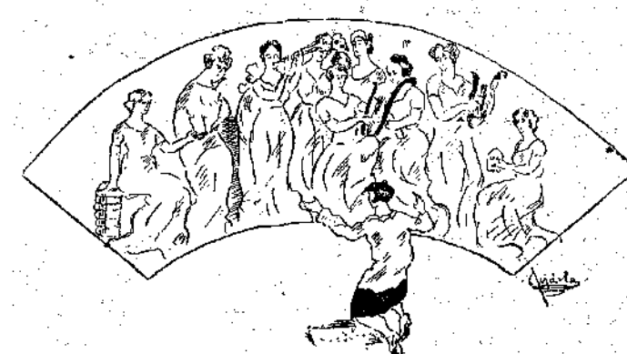
Η μεγαλύτερη ετυχία της Αιλάντας. (Επίσοπός της ίδιας.)

Και ύστερα άπ' αυτή την ωραία απάντηση, ερχόμαστε σ' εκείνους που θεωρούν γιά ετυχία τους την εκπλήρωση των ιδανικών τους. 'Η 'Αμίλλα πρώτα μας γράφει ότι βρσικα την ερώτησή μας πολύ καλή (ευχαριστούμε), δέν ξέρει όμως πως θα βρούμε έμεις την απάντησή της. Και η απάντησή της είναι ότι