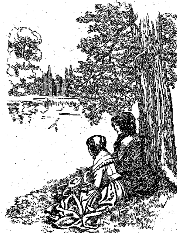
— Π. εἶπε νὰσαι προσεχτικῶς, καὶ νὰ μιλάς εὐγενικὰ... (Σελ. 235, στ. α.)