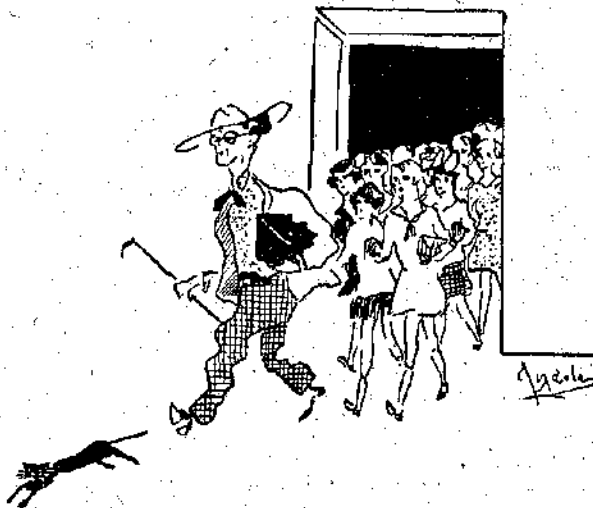
Ο 'Ανανίας με τα γυαλιά. (Επίσοπός της Αιλάντας.)

Βλέπετε τι καλό χορτάει; γιά πρότυπο μυαλό με παίρνει. 'Η 'Αταλάνη φοβάται μήπως η κυρά Μάρθα την πετάξει στη σόμπα της και «καή σιγά-σιγά». Πιστεύω πως θα έννοη την απάντησή της και όχι τον εαυτό της, αλλά πάλι πως μπορεί ένα χαρτί να καίγεται «σιγά-σιγά»; Μυστήριο τέλος πάντων. Κατά την 'Αταλάνη λοιπόν η μεγαλύτερη ετυχία είναι η εθεροεσία στην πατρίδα, γιατί τότε τόνομα του εθεργέτου θα μείνη άθνατο εις τους αιδνας. 'Η 'Ηβη θεωρεί ως τη μεγαλύτερη ετυχία την ελευθερία της πατρίδας, καθώς και ο 'Αμίμητος Γελοιοποιός, που λέει ότι μόνον όσοι έχουν εχθρό κάτω από το σκληρό ζυγό των Τούρκων, ξέρουν τι αξίζει η ελευθερία. Και τελευταίο ερχεται το 'Ονειρον του 'Ελληνισμού, που βαρέθηκε να λέει ότι είμαστε από-