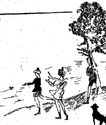
«Πήγαμε παντού καινο τ' άπόγεμα...»

— Ω, μά δλα τά ξέρεις εσύ! — Όχι, δλα... Μ' αυτό τό ξέρω,