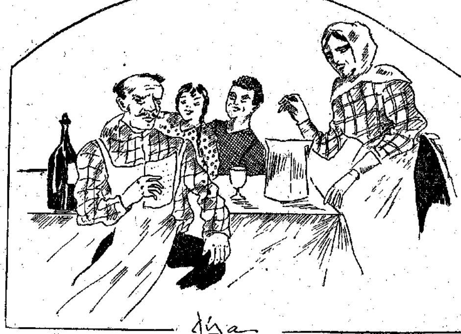
«Χαρά που θάκαναν οι δικοί μου όταν θά λάβαιναν τό γράμμα μου...» (Σελ. 185, στ. α')

Επιτέλους γδύθηκα κι' εγώ, έσβουσα τή λαμπίτσα και, σιγά-σιγά, για να μη