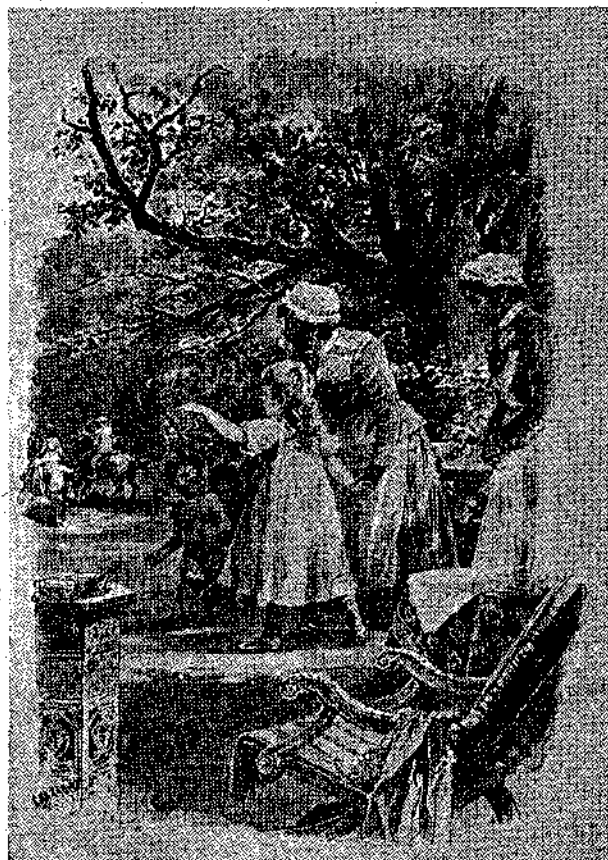
«— Στὸ καλὸ! στὸ καλὸ!» (Σελ. 181, στ. α'.)

Χωρὶς νὰ χάσῃ τὸν καιρὸ του σὲ ἀσκοπα λόγια, εἶπε νὰ τοῦ φέρουν μερικὰ φορεματάκια τοῦ παιδιοῦ καὶ τᾶδωσε στὸ σκύλι νὰ τὰ μυρίσῃ. Ὑστερα ἔκανε μὲ τὸ σκύλο ἓνα μεγάλο γύρο στὴ βεράντα, σὰν τὸν κυνηγὸ ποὺ ψά-