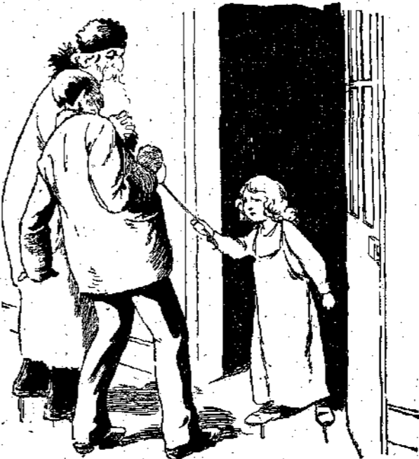
« Νά μήν περφέρετε τόν παππού Σολομών, γιατί άλίμονό σας ! » (Σελ. 178, στ. Β')

— Α, άστε δέ φεύγεις ε ; Γελάς ε ; Στάσου λοιπόν νά ιδεις. Στάσου ! Πάρ' τον λοιπόν !