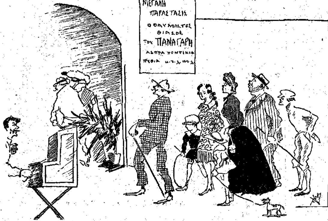
«Μαζεύτηκε κόσμος και κοσμάκης». (Σελ. 211, στ. α')

όλες μας, — τελείωσε όχι γιατί είχα μάθει «τέλεια» τ' ο τραγούδια μου, παρά μόνο γιατί είχα περάσει η ώρα, κι' είχαμε κουραστεί και δεν μπορούσαμε να εξακολουθήσωμε.