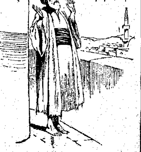
«Ἀπὸ τὸν γειτονικὸ μιναρέ, ὁ μουεζίνης καλοῦσε τοὺς πιστοὺς νὰ προσευχηθοῦν...» (Σελ. 207, στ. α')

Καὶ καμώθηκε πῶς δὲν τὴν ἔβρισκε στὴν παραζάλη της, ἢ πῶς δὲν μπορούσε νὰ τὴν πιάσῃ. Μιὰ στιγμὴ ὅμως ποὺ τὴν εἶδε νάνεβαίνῃ ἀπάνω σὰν φλόγια, τὸ μετάνουωσε, τὴ λυπήθηκε, τὴν ἔ-