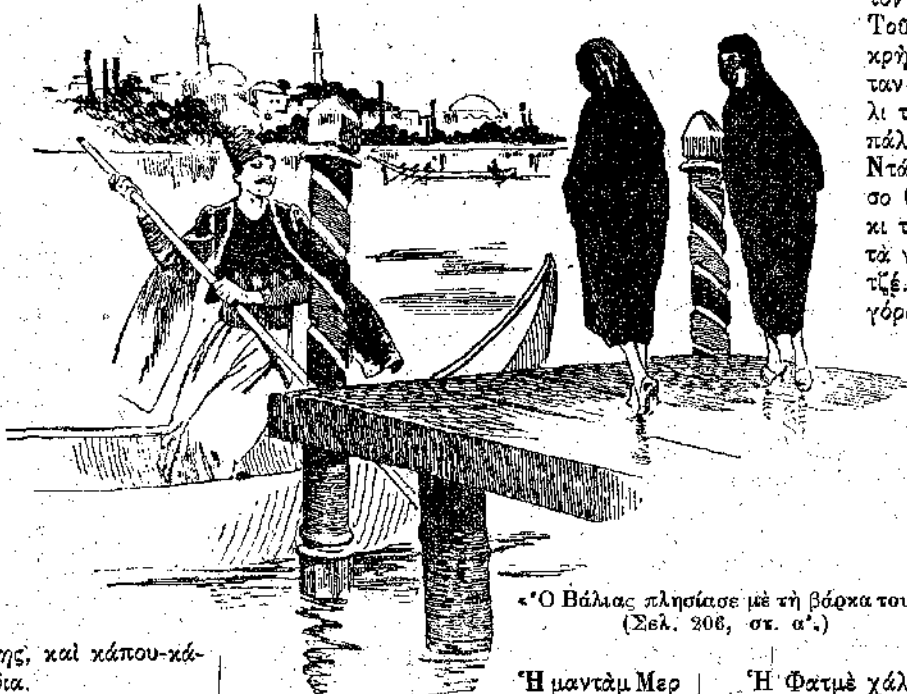
*Ὁ Βάλιας πλησίασε μὲ τὴ βάρκα του. (Σελ. 208, στ. α'.)

σεραί, δὲν θὰ μπορούσε : ἡ Φατμέ θὰ τὴν κρατοῦσε μὲ τὸ στατιό. Μὰ δὲν ἤθελε κίβλα. Δὲν ἦταν τρελὴ ν' ἀφήσῃ «γιατὸ φύλλον πῆδημα» τὴ λαμπρὴ τῆς θέση. Φοβέριζε μόνο. Καὶ βλέποντας πὼς ἡ φοβέρα τῆς δὲν περνοῦσε, σκέφθηκε νὰ μεταχειρισθῇ ἄλλα μέσα, γιὰ νὰ μεταδώσῃ στὴν ἴδια τὴ Φατμέ τὴν ἀντιπάθειά τῆς γιὰ τὴ Ντάλα.