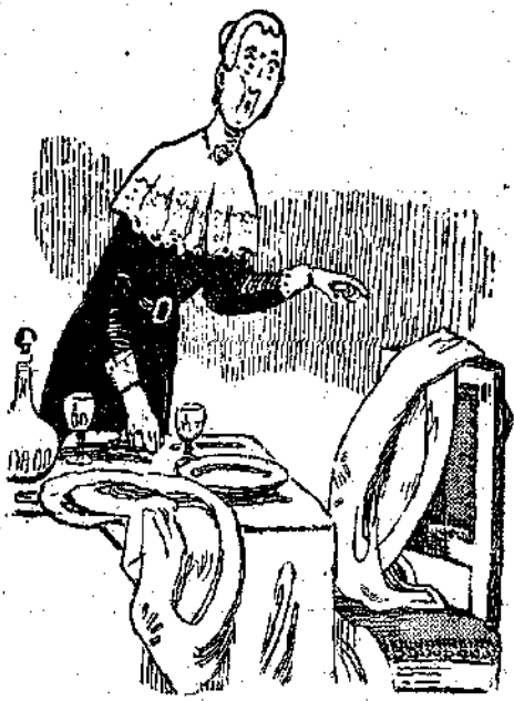
— Ε! τι; και τις πετούστε σας; λέει η θειά Άγλαία.

Το σιγανό αυτό παράπονο βρήκε άμέσως απήχηση στο Ζοζό.