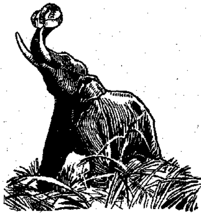
«Ἐσφριζόναν τοὺς στύλους καὶ τὰ σημάδια τῶν χιλιομέτρων...» (Σελ. 422, στ. γ')

ὁ Γιόγκ. Ἦταν σίγουρος ὅτι χθὲς εἶχε στήσει τὸ στύλο τοῦ 125οῦ χιλιομέτρου καὶ σήμερα δὲν τὸν βρῆκε!