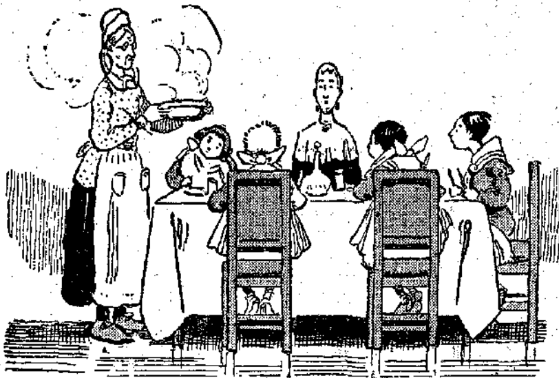
— Βεβαιότατα! έχω εφαρμόσει από πολύν καιρό τη φυτοφαγική διαίτα... (Σελ. 425, στ. γ')

Ευτυχώς που η θειά Άγλαία έγινε πάλι κουφή και το πρόσωπό της ήταν ήρεμο την ώρα που γέμιζε τα πιάτα των άνηψιών της. Οι κουφοί καθώς φαίνεται δεν άκουν τις διαμαρτυρίες των άλλων. Το καλύτερο λοιπόν που είχε να κάνει ο καθένας ήταν να σιωπάση και να φάη, τι βρισκόταν μπροστά του.