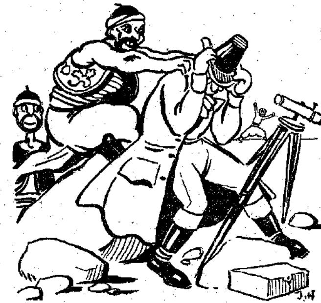
«Αἰχμαλωτισθῆκε κι' ὁ σοφὸς μαθηματικὸς κι' ἀστρονόμος Ἀραγὸ...» (Σελ. 470, στ. α'.)

ἦταν σχεδὸν τὸ ἴδιον πράγμα κι' οἱ ἄνθρωποι ἔκαναν τῆς ἐμπορικῆς συναλλαγῆς τοὺς ἀρματωμένους ὡς τὰ δόντια.