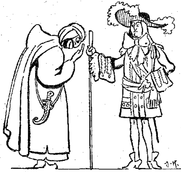
«Ἐγινε δεκτικὸς στὸ παλάτι τῶν Βερσαλλίων...» (Σελ. 470, στ. α'.)

Ἀρχαιότατοι, συστηματικοὶ θαλασσοπόροι ἦταν οἱ Φοίνικες. Ὁ φανερὸς σκοπὸς τους ἦταν τὸ ἐμπόριον. Ἀλλὰ στὸ βῆθος ἦταν κοινότατοι πειρατῆς ποὺ δὲ δισταζαν διόλου νὰ ἠστέψουν παράλλους πόλεις ἢ νὰ κρατήσουν αἰχμαλωτοὺς τοὺς ἐμπόρους, ποὺ συναλλάσσαν μαζί τους. Στους χρόνους ἐκείνους, ἐμπόριο καὶ πειρατεία