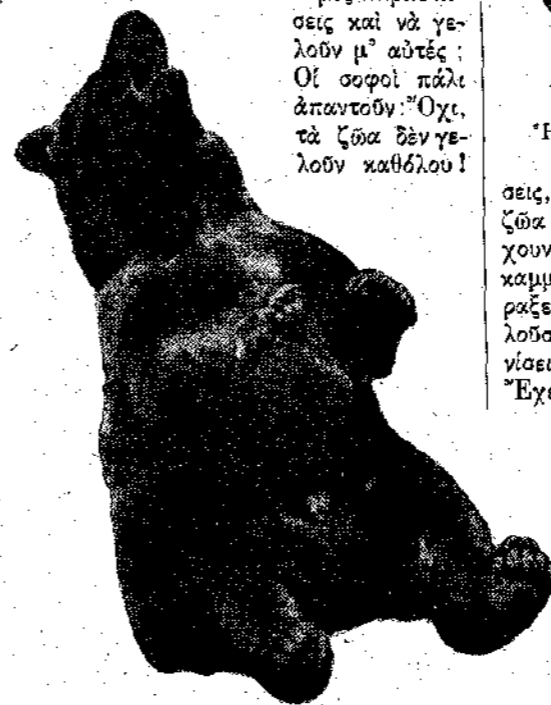
Η άρκούδα που ξεραίνεται στα γέλια.

Τώρα, τα ζώα μπορούν να έχουν εύθυμες παραστάσεις και να γελούν μ' αυτές; Οι σοφοί πάλι άπαντούν: Όχι, τα ζώα δέν γελούν καθόλου!