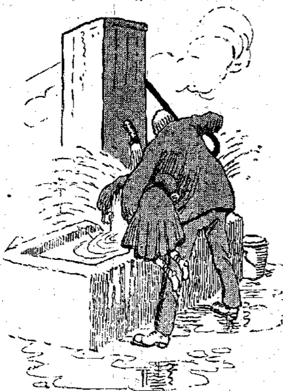
«Και τρομπάρης αφθονο νερό.»

— Διακοπές; Και γιατί θέλετε έσεις να κάνετε διακοπές, τη στιγμή που όλοι οι μαθητές, στη Γαλλία, θα μείνουν κλεισμένοι στα σχολεία ως τον Ιούλιο;