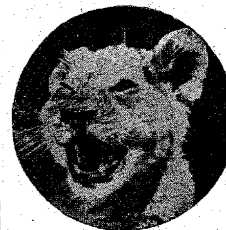
Η λεοπαρδαλη με το κάλοκαρδο γέλιο.

Όστε; Πρέπει να πούμε, ότι οι παρατηρήσεις αυτές βγάζουν ψεύτικα τα συμπεράσματα των σοφών; Όχι! Ο ίδιος Γερμανός, από καλύτερες παρατηρή-