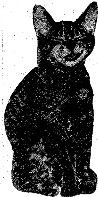
Η γάτα που γελά μ' όλο της το κέφι.

Το συμπέρασμα λοιπόν είναι ότι τα ζώα δέν γελούν, έστω κι' αν στα πρόσωπά τους παρατηρούνται καμμιά φορά οι κινή-