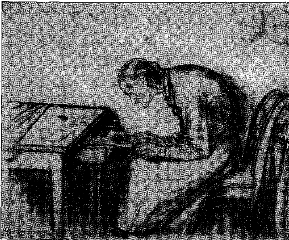
«Καὶ τὴν κοιτάζει, τὴν κοιτάζει, ὡς ποὺ τὰ μάτια τῆς θαμπώνουν...» (Σελ. 577, στ. γ.)

— Ἄς εἶναι καλά ὁ καιμένος ὁ Βαγ- γέλης, ψιθυρίζει, ποὺ μοῦ μεγάλησε τὴ