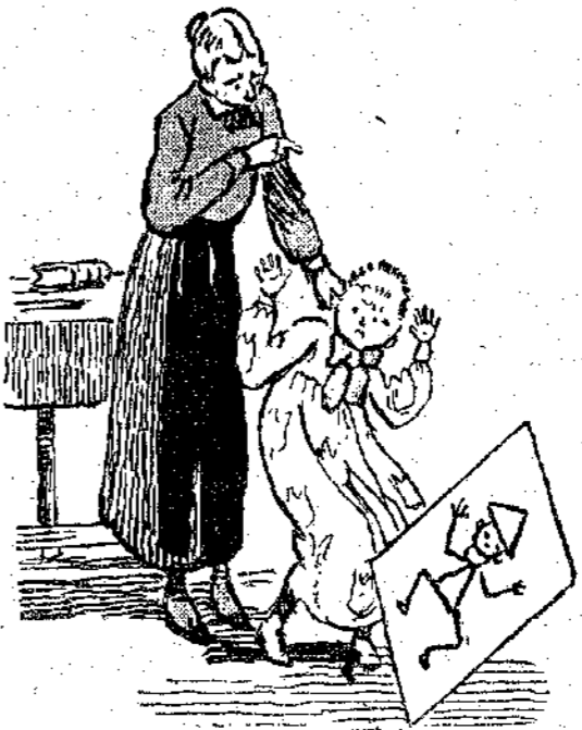
«Ζωγράφισε ένα θαυμάσιο παραμύθι...» (Σελ. 571, στ. γ΄.)

ούτε τόν παραμικρό θόρυβο. Μιλούσαν με χαμηλή φωνή και τó θέμα όλων των συζητήσεων ήταν ό άτυχτος Πετράκης. Καταλαβαίνουν πολύ καλά ότι ή τιμωρία του τού αξίζει, αλλά μολαταύτα τά παιδιά έχουν δλα τήν ίδια γνώμη: "Ο θεός Βαρνάβας είναι ένας θεός φοβερός.