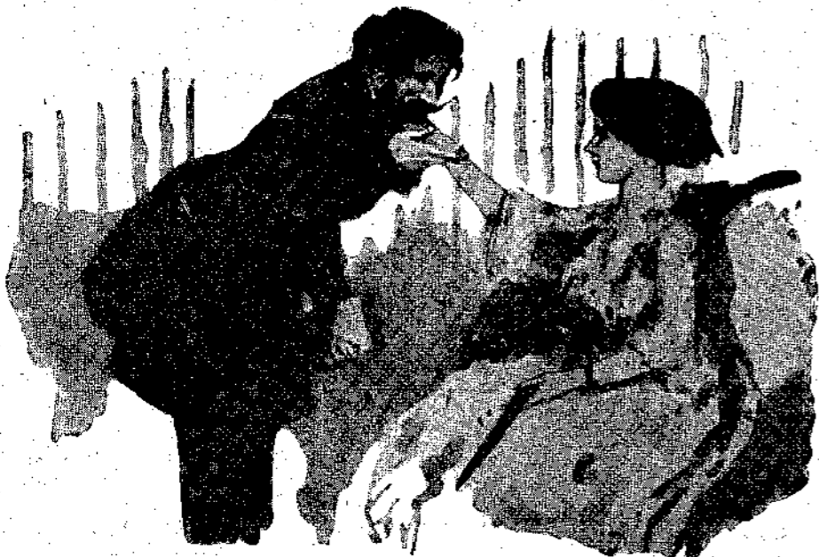
«Αυτά δέν είναι ποιήματα, κυρία μου, είναι άνοησίες!» (Σελ. 589, στ. α΄.)

Κι' άληθινά ήταν ένα ποίημα, ένα ποίημα πένθιμο, πού άρχιζε έτσι: