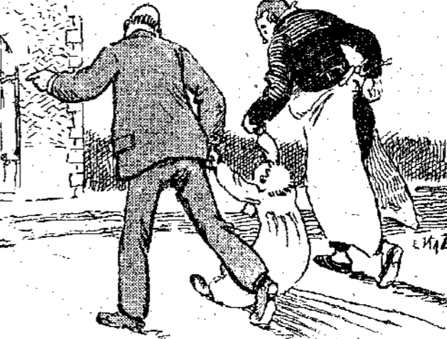
«Ο ένοχος άνάμεσα στους δυό φύλακές του». (Σελ. 583, στ. α΄.)

Κι' έτσι, όχι μόνο τήν ημέρα εκείνη, αλλά και τις επόμενες ή φρονιμάδα των παιδιών είναι έποδειγματική. "Ο Πετράκης βγήκε βέβαια άπό τή φυλακή του, με κοιμμένη όμως κάθε όρεξη για άνταρσία. Τά παιδιά μελετούν, κάθονται φρόνιμα στο τραπέζι, παίζουν χωρίς νά κάνουν φαουρίες, γράφουν στους γονείς τους γράμματα, γεμάτα λεπτομέ-