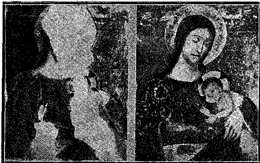
ἘΝΑ ΠΑΛΙΟ ἈΡΙΣΤΟΥΡΓΗΜΑ ΤΕΧΝΗΣ

Τέτοια ἡ εἰδικὴ τέχνη τοῦ Πελεκάσης ἔχει διχάσει ἓνα πλήθος, ποὺ στολί- ζουν σήμερον δημόσια Μουσεῖα καὶ ἰδιωτικὰς Πινακοθήκας. Καὶ κερδίζει, κερδίζει βέβαια πολλὰ, ὁ Πελεκάσης μὲ τὴν ὠραία τέχνην του. Νὰ ξέρετε ὅμως καὶ τὴν τοῦ στοιχίαι! Χωριστὰ οἱ κόποι, οἱ ἀγρύπνιαι, τὰ ἐξέδα, τὰ ταξίδια, οἱ ἀγῶνες μίαις ὀλίκερης νιότης. Τοῦ