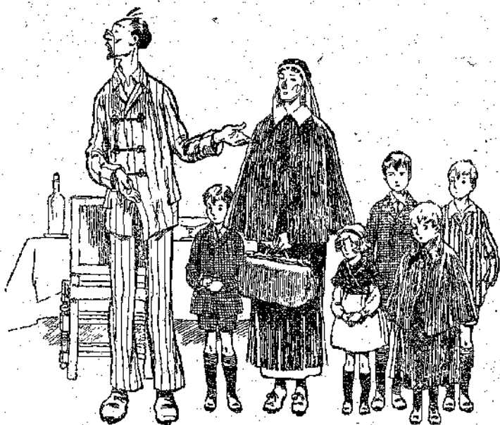
«Ὁ κ. Ἀχιλλεὺς Ἀντριωμένος σύστησε τὴ μίς Κλάριτς...» (Σελ. 134, στ. α').

— Ἐ, μὲ διασκεδάζετε λαμπρὰ ἐδῶ μέσα, καθὼς βλέπω! εἶπε ὁ κ. Τζέφ Στέφενσον χαμογελώντας. Ἐξακολούθη-