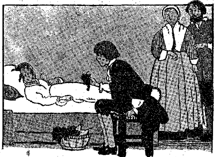
«Πῆγε νὰ ἐπισκεφθῇ τὸ μικρὸ ἄρρωστο». (Σελ. 217, στ. β')

— Καὶ τί μὰς νοιάζει ἂν ἔχουν βασίλισσα ἢ ἔχουν δημοκρατία; Ἀρκεῖ νὰ κάνουν μέλι καὶ νὰ τὸ τρώμε!