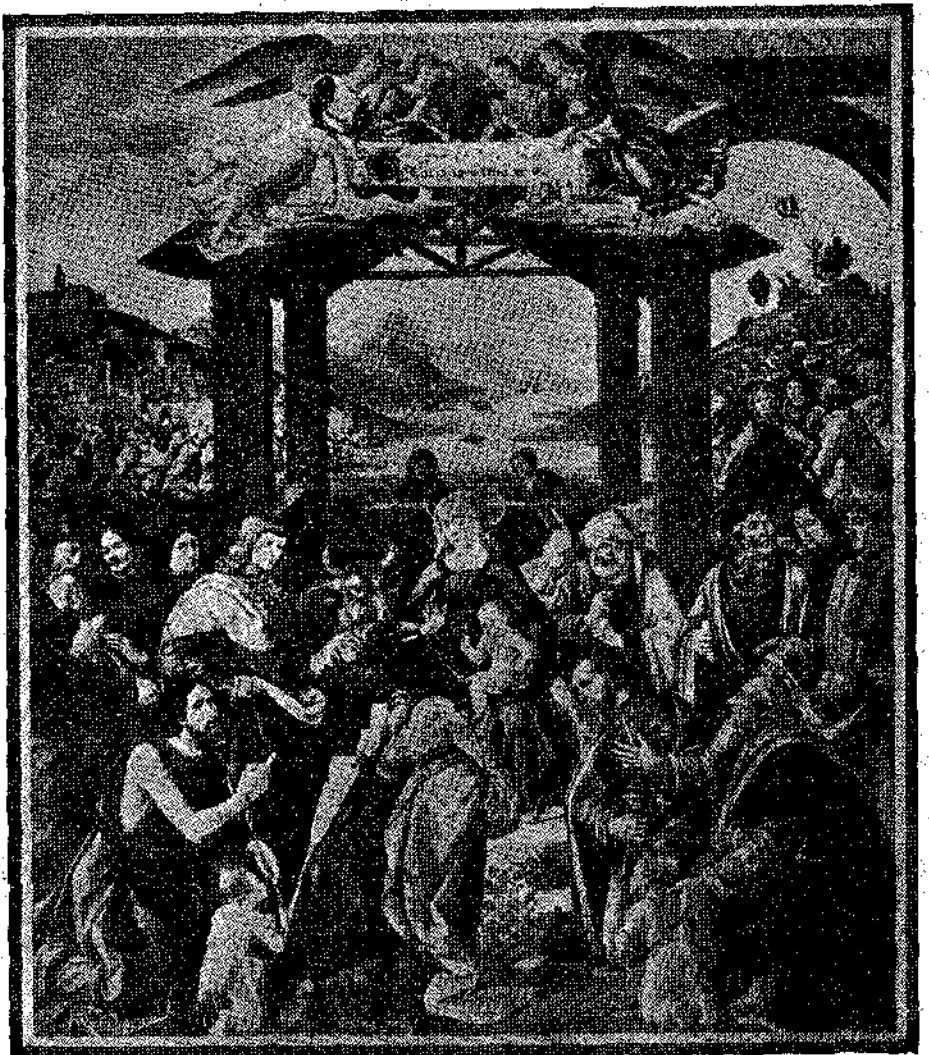
ΧΡΙΣΤΟΥΓΕΝΝΑ, εἰκόνα τοῦ παλίου ζωγράφου βομενικο Ghirlandajo ἀπὸ τὴ Φλωρεντία.

Στὴ στιγμὴ τὸ ζῶο μουγγάθηκε, σωρίσθηκε στὰ πόδια του καὶ βάλθηκε νὰ τοῦ τὰ γλύψη, χτυπώντας τὴν οὐρά του.