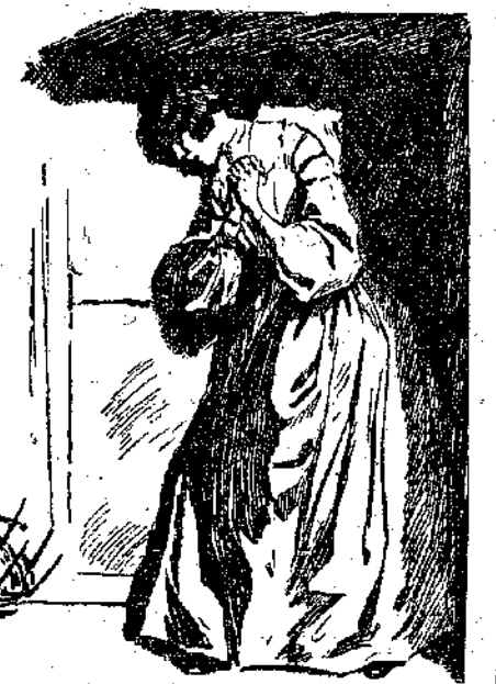
«Έβαλε τ' αυτί της στην πόρτα και τάκουσε όλα».

«Όλοι παρακάλεσαν τότε τόν Τζώρτζη να διαβάσει τὰ τελευταία κεφάλαια της «Αποκάλυψης». Ο Τζώρτζης ήταν παιδί μορφωμένο κι' η μητέρα του τού είχε διδάξει πολλά πράγματα σχετικά