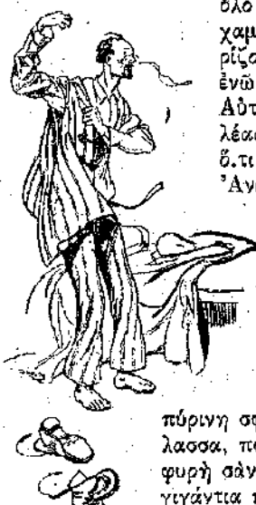
«Φόρεσε τις μπυτζάμες του με βία...» (Σελ. 31, στ. γ')

«Όστόσο τó «Φίνμαρκ» εξακολουθούσε τó δρόμο του. Από τó βόρειο άκρωτήριο έστριψε στα βορειοδυτικά για να περιπλεύση τó νησί των Άρκτων, που βρίσκεται στη γραμμή της Σπιτσεβέργης. Ός εκεί επάνω όμως δέν τραβούσε τó δρομολόγιο τού βαποριού. Γυρίζοντας απ' τó νησί, θά πλησίαζε τή Νορβηγική άκτή που βρίσκεται πίσω από τες Λοφφόντεν και θά περνούσε από τó Χάμμερφεστ, τó Τρόμζο και τó