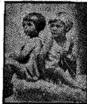
ΤΑ ΛΑΒΑΦΑΚΙΑ ΤΑ ΤΣΟΥΓΓΡΕΛΑΝ