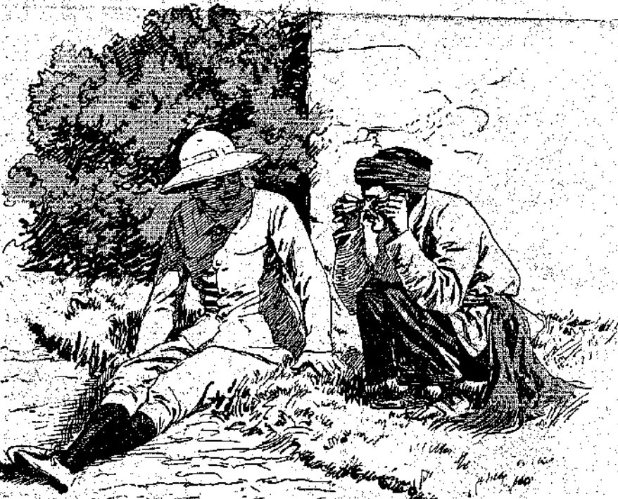
«Τους είδα με τή ίδια μου τή μάτια, έκανε ο Μό...»

Ήταν ένας άνθρωπάκος μικροκαμωμένος, αδύνατος και σπανός, που δεν θά φαινόταν πάνω από τριάντα χρονών, μδλο που είχε ήκμήσει τή σαράντα και ήταν παντρεμένος πολλά χρόνια. Ο τίτλος του τόν έδωζε σε θέση ανώτερη από τών άλλους συμπολίτες του που ήταν είτε γεωργοί, είτε τεχνίτες, και γι' αυτό έκείνοι τόν ζηλεύανε και για να τόν προσβάλλουν τόν φώναζαν: «σκύλο, που δουλεύει τούς παλιόφραγκους!»