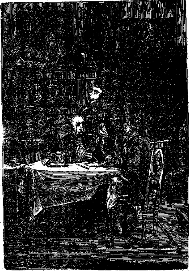
Ο όηπρήτης έσπριζε κάτω όλας της πυραμίδα από κιατικά...

Μού γράφει ένας σολίαιτος, ένας συμβολαιογράφος να πούμε ή δικηγόρος, ή και τδ δυό μαζί, τού τδ που εκείνου, εξακολούθησε δυνατά ο κ. Κλοακέν. Μά όλα τδ ξέρουν αυτοί οι άνθρωποι! Άκουσε δώ: