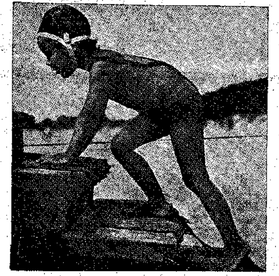
Τδ «Παιδί τού Ήλιου», μελαψό σαν χάλκινο άγαλμα, κάνει τδ μπάνιο του στη θάλασσα τού νησιού του, στον Ίνδικό Ωκεανό.