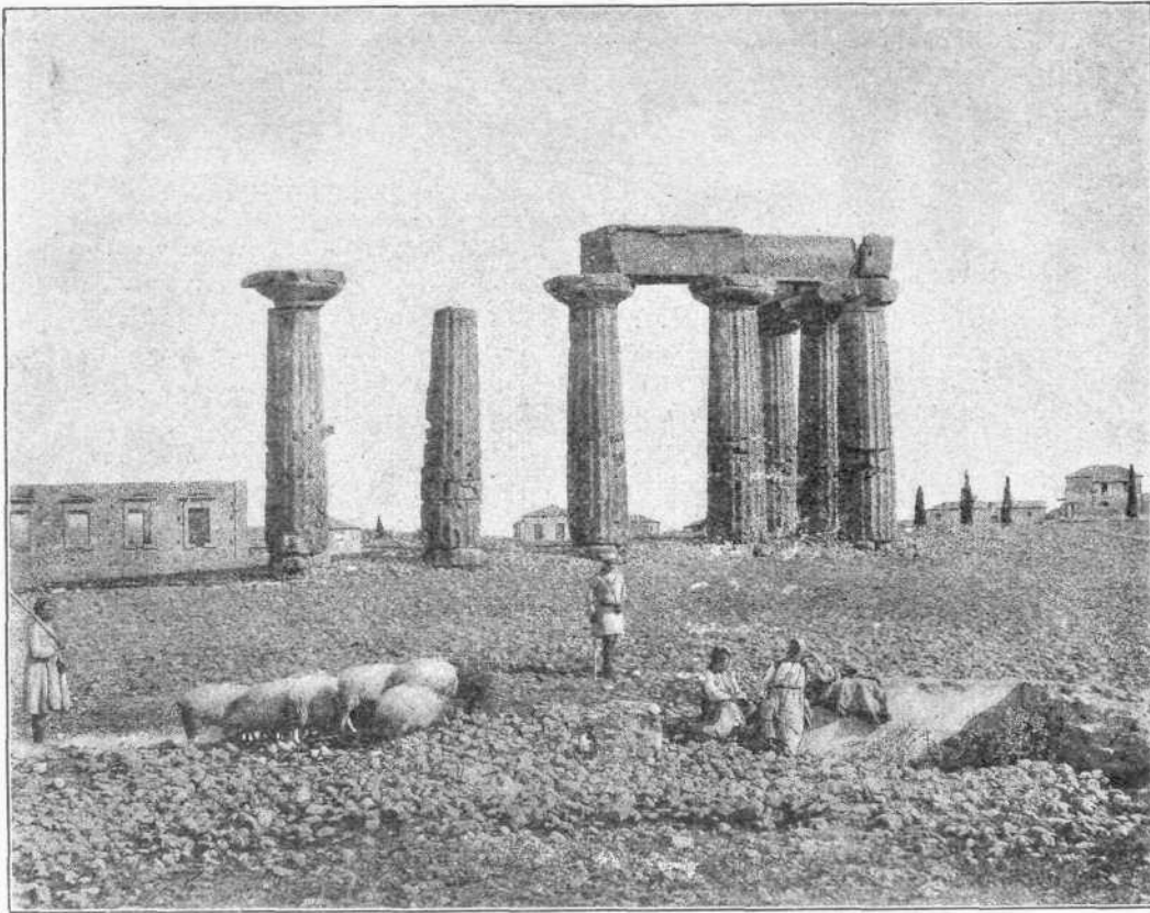
ΔΕΛΦΙΚΟΣ ΝΑΟΣ ΕΝ ΚΟΦΙΝῳ (Ἐκ φωτογραφίας Π. Μωραΐτου)

σεις, ἀλλ' ἤρκει ἡμῖν νὰ ἀπαντήσωμεν γενικῶς ὅτι ἐμμένομεν εἰς πάντα τὰ καθορισθέντα ὑπὸ τοῦ Ἱεροῦ Συνεδρίου κατὰ τὸ παρελθόν καὶ εἰς ὅ τι ἤθελε τοῦτο καθορίσει καὶ ἐν τῷ μέλλοντι ἐν τε τῷ προκειμένῳ θέματι καὶ ἐν πᾶσι τοῖς ἄλλοις· ἀλλ' ἐξεβιάσθημεν ν' ἀπαντήσωμεν ἐν ἐκτάσει διότι ἄλλως σύμπας ὁ κόσμος θὰ ἐψέγεν ἡμᾶς ὅτι συμφωνοῦμεν μετὰ τῶν Γραικῶν, ὃ δὲ ἡμέτερος Ἀρχιεπίσκοπος θὰ ἔκαμνεν ἴσως προσβολὴν τινα. Ταῦτα, ἰκετεύω τὴν Ἑμετέραν Αἰδεσιμωτάτην Πατρότητα νὰ παραστήσῃ ζωηρῶς εἰς τὸ Ἱερὸν Συνέδριον καὶ νὰ ζητήσῃ ἰκανοποίησιν διὰ τὰς τόσον ἀδίκως γενομένας καθ' ἡμῶν παρεκτροπὰς.