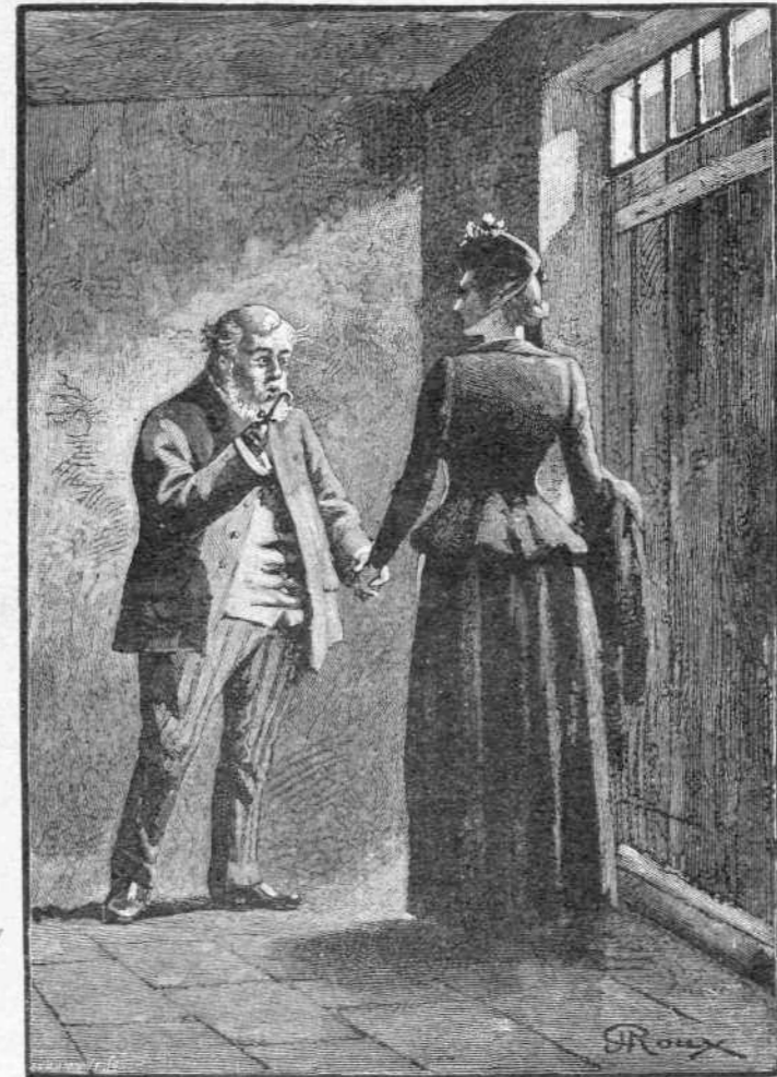
Οὕτω περίπου ἐπερατοῦτο ἐκάστοτε ἡ συνδιάλεξις (σελ. 301).

— Ἐγώ; ἀγαπητὴ Μάστων! Τόσον κακῶς λοιπὸν μὲ ἐκτιμᾶτε; Ἐγώ! Νὰ σὰς παρακαλέσω