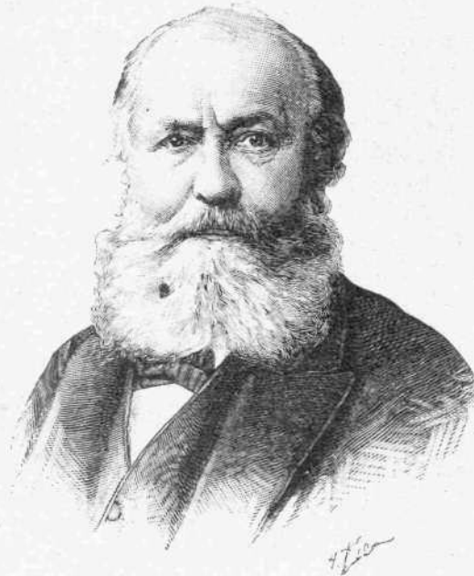
ΚΑΡΟΛΟΣ ΓΚΟΥΝΟΣ Ὁ μελοποιὸς τῆς «Ἰωάννας δ' Ἄρκου».

ταῦτα, ἀλλ' ὑπὸ καλολογικὴν μᾶλλον καὶ αἰσθηματικὴν ἢ ἐπιστημονικὴν ἐποψίν. Ἐσκέπτετο ὅμως. Πάσαι αὐταὶ αἱ ἐρωτήσεις, πάσαι αἱ ἀμφιβολίαι, ὁ κρυφίος σκοπὸς τῶν συνδιαλέξεων της, ἢ τόσον ταχεῖα ἴσως πρὸς τὸν φίλον αὐτῆς ἀφοσίωσίς της, πάντα ταῦτα αἰτίαν εἶχον τὴν ἀσθεστον τῆς μαθήσεως διψᾶν ὑφ' ἧς κατείχετο ἡ ψυχὴ της. Ἡλπίζεν εἰς αὐτόν, διότι εἶχεν ἤδη ἀνεύρει εἰς τὰ συγγράμματά του τὴν ἐπίλυσιν τῶν μεγίστων προβλημάτων. Ἐδιδάχθη ἐξ αὐτῶν νὰ γνωρίσῃ τὸ σύμπαν καὶ τὴν γνῶσιν ταύτην εὕρισκεν ὠραιοτέραν, ζωηροτέραν, μεγαλύτεραν, ποιητικωτέραν ἀπὸ τὰς ἀρχαίας πλάνας καὶ ἐσφαλμένας δοξασίας. Ἀπὸ τῆς ἡμέρας καθ' ἣν ἔμαθεν ἀπὸ τῶν χειλέων του ὅτι ἡ ζωὴ δὲν εἶχεν ἄλλον σκοπὸν εἰμὴ τὴν ἀναζήτησιν τῆς ἀληθείας, ἦτο βεβηκία ὅτι θὰ τὴν