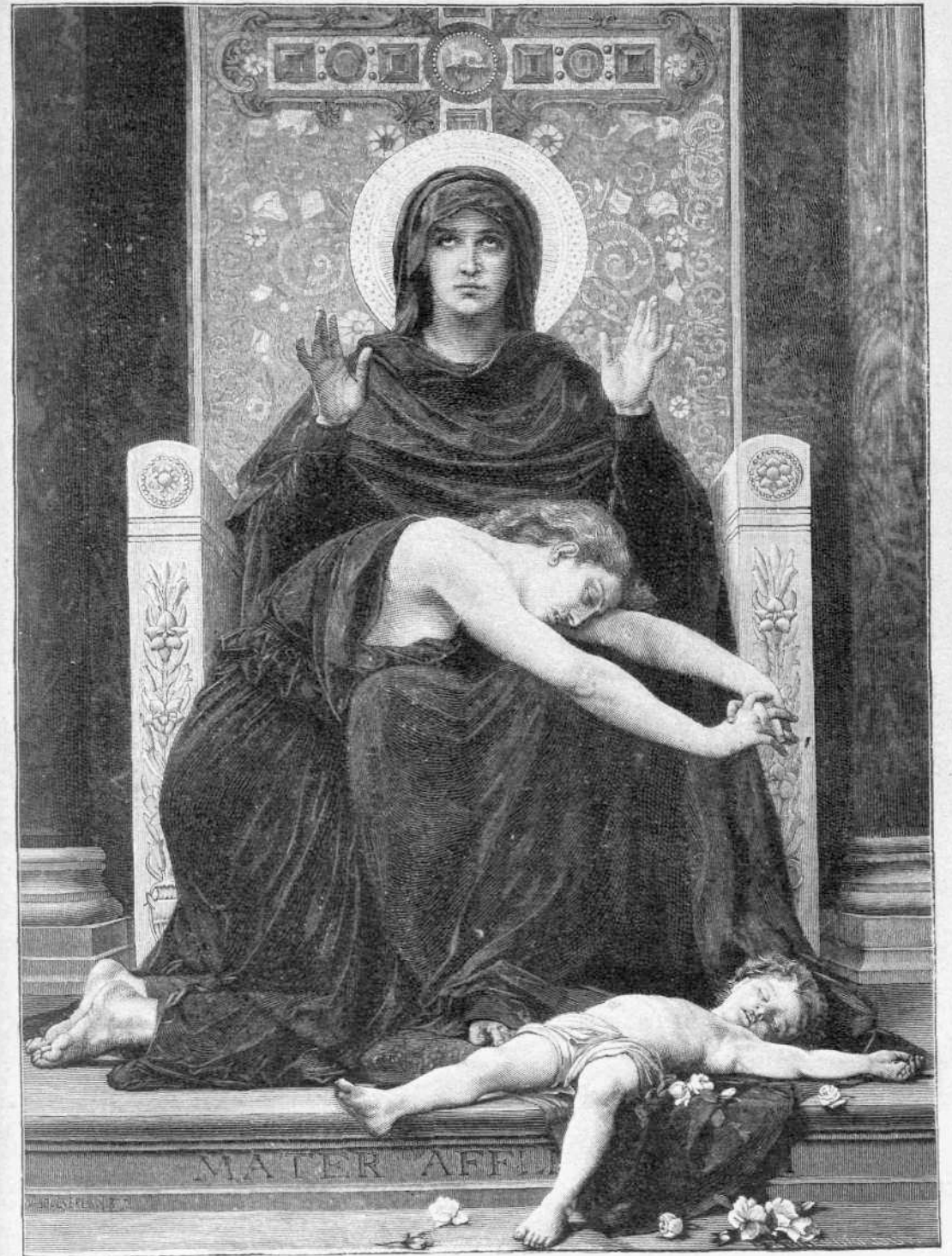
Ἡ ΜΗΤΗΡ ΤΩΝ ΤΕΘΛΙΜΜΕΝΩΝ Εἰκὼν Βουγενῶ.

φιλοσοφίας, τῆς θεωρίας τῶν ἀτόμων, τῆς φυσικῆς, τῶν μορίων τῆς ὀργανικῆς χημείας, τῆς θερμοδυναμικῆς καὶ τῶν διαφόρων ἐπιστημῶν ὧ, ὁ σκοπὸς τείνει εἰς τὴν ἐξακριβωσιν τοῦ ὄντος, διαλεγόμενοι περὶ τῶν καθ' ἐπιφάνειαν ἢ πραγματικῶν ἀντιφάσεων τῶν ἐν αὐτοῖς εἰκασίων, εὕρισκοντες ἐνίοτε εἰς συγγραφεῖς καθαρῶς φιλολογικῆς ἰδιότητος σκέψεις καὶ συμπτώσεις λίαν ἐκπληκτικὰς μετὰ τῶν ἐπιστημονικῶν ἀξιωματικῶν, ἐκπληττόμενοι διὰ τινὰς προγνώσεις μεγάλων συγγραφέων. Τὰ ἀναγκώματα καὶ αἱ ἐρευναι καὶ αἱ παραβολαὶ αὐταὶ τοὺς ἐθειλγον ἰδίως ἕνεκα τοῦ ὅτι τὸ ἰσημέραι φωτιζόμενον ἐτι μᾶλλον πνεῦμά των κατήντα ν' ἀπορρίπτῃ τὰ ἐννεὰ δέκατα τῶν συγγραφέων, ὧν τὰ ἔργα εἶνε καθ' ὀλοκληρίαν κενὰ καὶ τὸ ἤμισυ προσέτι τοῦ τελευταίου δεκάτου αὐτῶν, ὧν τὰ συγγράμματά