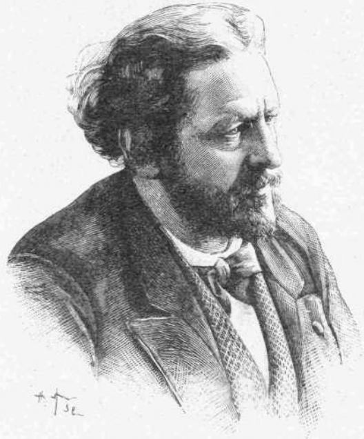
ΙΟΥΛΙΟΣ ΒΑΡΒΙΕ Ὁ ποιητὴς τῆς «Ἰωάννας δ' Ἄρκου».

Πρὸ τριῶν περίπου μηνῶν ἔζων αὐτῶ κοινήν πνευματικὴν ζωὴν, κατατρίβοντες σχεδὸν καθ' ἐκάστην πολλὰς ὥρας τῆς ἡμέρας εἰς τὴν ἀνάγνωσιν πρωτοτύπων ὑπομνημάτων γεγραμμένων εἰς διαφόρους γλώσσας περὶ τῆς ἐπιστημονικῆς