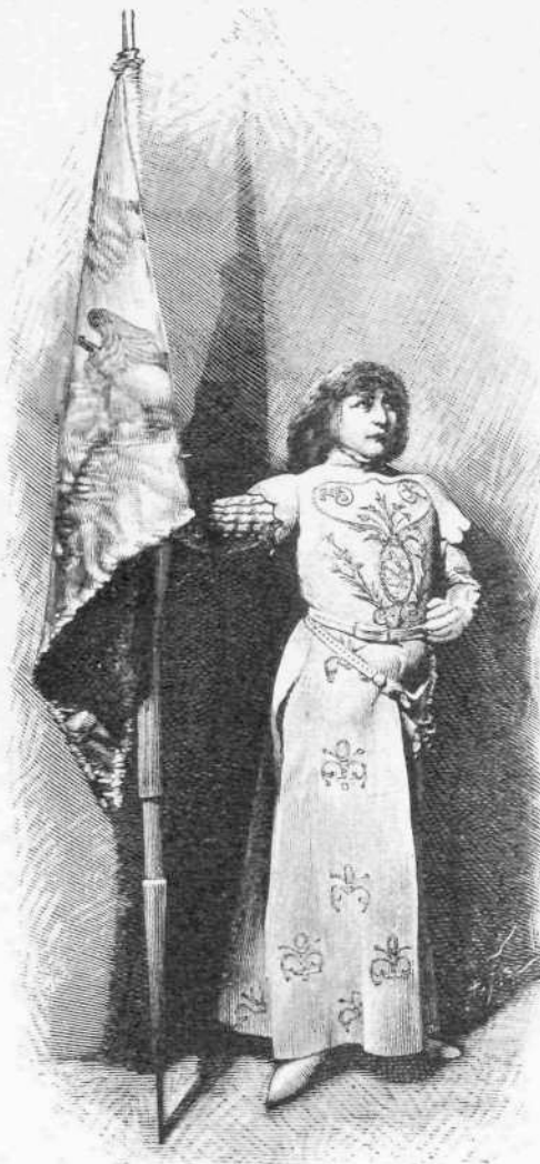
Η ΣΑΡΡΑ ΒΕΡΝΑΡ ὡς Ἰουλιανὰ δ' Ἄρξ.

λην τὴν ἑκτασιν τὴν οὐ μικράν τοῦ κλεινοῦ ἡμῶν καὶ ἰσπερᾶνου ἄστεως ὑπάρχει ἐν καὶ μόνον δη- μόσιον ὠρολόγιον, τὸ τῆς Μητροπόλεως, τὸ ὁποῖον.. δὲν λειτουργεῖ. Εἶνε ἀληθὲς ὅτι καθ' ἐκάστην