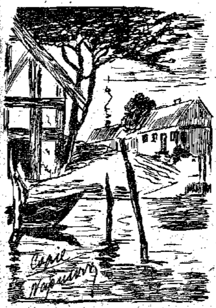
Που είναι ο νοικοκύρης της βάρκας; (Αντηγόρησι και ένδοκονώθη από τόν Νάρμισσο)