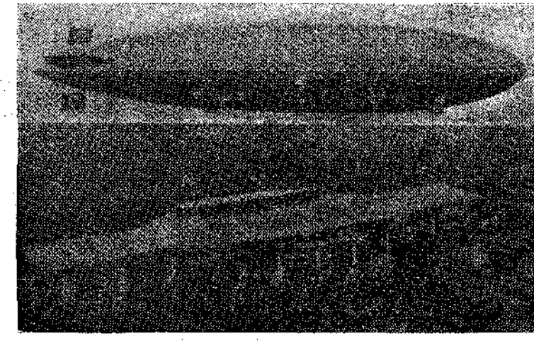
Η πλατή νήσος, κατά τό σχέσιο του Άρμστρουγκ. Άπό πάνω της τό ηηδαλιουχούμενο «Χίντεμποργκ», τό μεγαλύτερο του κόσμου.

κείνος πού ακολουθούν τά υπερωκεάνεια. Στο σημείο αυτό ή γαλλική άκτή δέν απέχει άπό τήν άμερικανική παρά μονάχα 5608 χλμ. Όστόσο κι' ή άπόσταση αυτή άκόμη είναι άρκετά σημαντική, και γιά νά τή διανύση ένα αεροπλάνο πρέπει νά έχη μαζί του σημαντική προμήθεια βενζίνης.