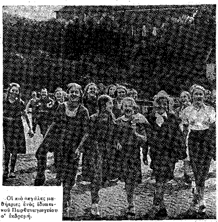
Οι πιο μεγάλες μηθήριες ενός ιδιωτικού Παιδογυμνασίου σ' έκδρομή.