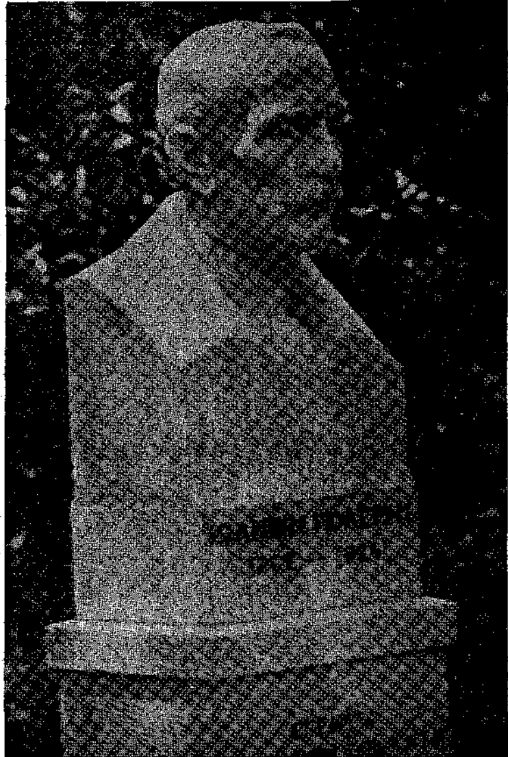
Ἡ ΠΡΟΤΟΜΗ ΤΟΥ ἸΩΑΝΝΟΥ ΠΟΛΕΜΗ ΣΤΟ ΖΑΠΤΕΙΟ ποῦ ἔγιναν ἀποκαλυπτῆριά της τὴν περασμένη Κυριακῇ.