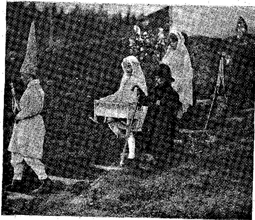
Παιδιά που λένε τα κάλαντα στη Γερμανία [Βλέπε και εικόνα στη σελ. 25]

Η Σάλλυ Μάκ-Μπράιτ με βοήθησε να διαλέξω αυτά τα πράγματα στο ξεπούλιμα που έκαναν οι Μεγάλες. Βλέπετε έχει περάσει όλη τη ζωή της μέσα σε αλήθινό σπίτι και