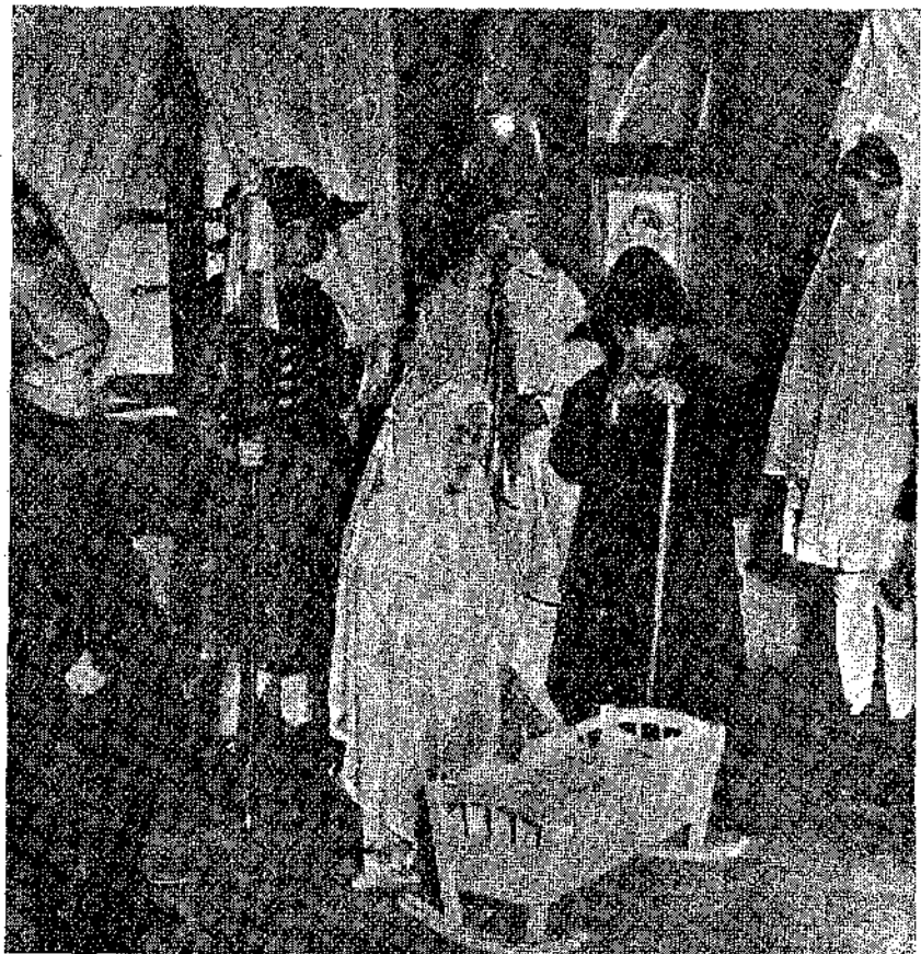
Παιδιά ποῦ λένε τὰ κάλαντα στὴ Γερμανία