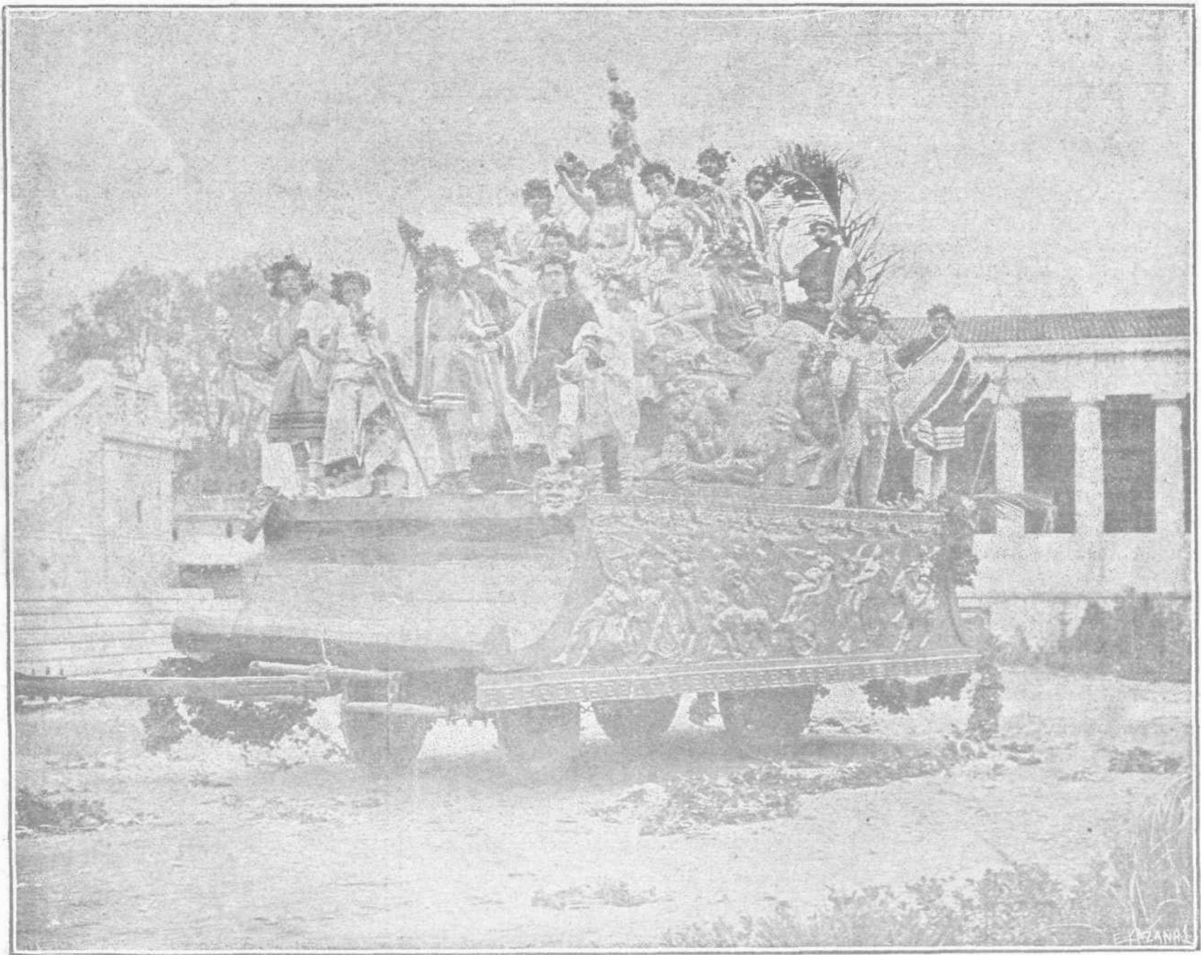
ΑΙ ΛΙΟΚΡΕΩ ΕΝ ΑΘΗΝΑΙΣ.—ΤΟ ΑΡΜΑ ΤΟΥ ΔΙΟΝΥΣΟΥ