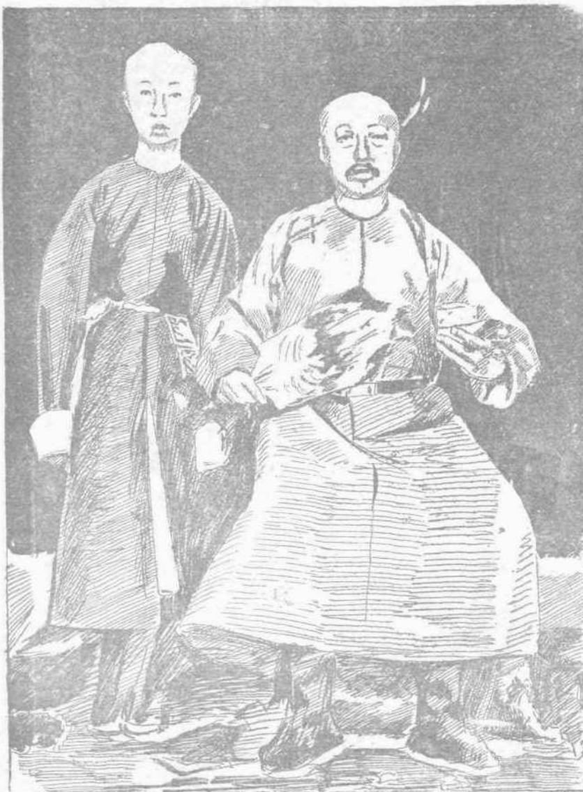
Ο ΑΥΤΟΚΡΑΤΩΡ ΕΙΣ ΗΛΙΚΙΑΝ ΔΕΚΑ ΕΞ ΕΤΩΝ ΜΕΤΑ ΤΟΥ ΠΑΤΡΟΣ ΤΟΥ

Ὁ Αὐτοκράτωρ τῆς Κίνας εἶναι πρόσωπον ἱερὸν καὶ ἀπαρβίαστον καὶ ἀφοῦ οὐδεὶς κοινὸς θνητὸς κατορθώνει νὰ τὸν βλέπῃ, αἱ φωτογραφίαι του, — αἱ ἀληθεῖς, ἐννοεῖται, φωτογραφίαι του, — εἶναι σπανιστάται. Διὰ τοῦτο ἀληθὲς ἀπόκτημα θεωρεῖ ἕνα ἀγγλικὸν περιοδικὸν τὰς δύο ἀνωτέρω εἰκόνας, οἵτινες παριστάνουν τὴν Α. Μεγαλειότητα τὸν Υἱὸν τοῦ Οὐρανοῦ κατὰ τὴν παιδικὴν ἡλικίαν του καὶ τὰς ὁποίας σπεύδει νὰ μεταφέρῃ εἰς τὰς στήλας τῆς καὶ ἡ «Κυριακάτικη». Ἐννοεῖται ὅτι ὁμιλοῦντες περὶ τοῦ Αὐτοκράτορος τῆς Κίνας ἐννοοῦμεν τὸν ἀτυχῆ ἡγεμόνα Τούγκ χι, τὸν δεσμώτην τοῦ ἀπεράντου ἐν Πεκίνω βασιλικοῦ ἀνοκτοροῦ, τὸν ὁποῖον καθήρεσε καὶ ἐξεθρόνισε πρὸ δύο μηνῶν μία γυνή, ἡ γῆρα Αὐτοκράτειρα Τσοῖ Τσοῖ, ἥτις ὑπῆρξεν Ἀντιβασίλισσα μέχρι τῆς ἐνηλικισσεως του.