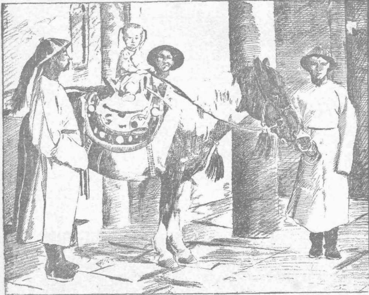
Ο ΑΥΤΟΚΡΑΤΩΡ ΤΗΣ ΚΙΝΑΣ ΕΙΣ ΗΛΙΚΙΑΝ ΤΡΙΩΝ ΕΤΩΝ — (Ο πατήρ του πρίγκιψ Τσοούν ιστάται εις τὰ ἄριστερά).