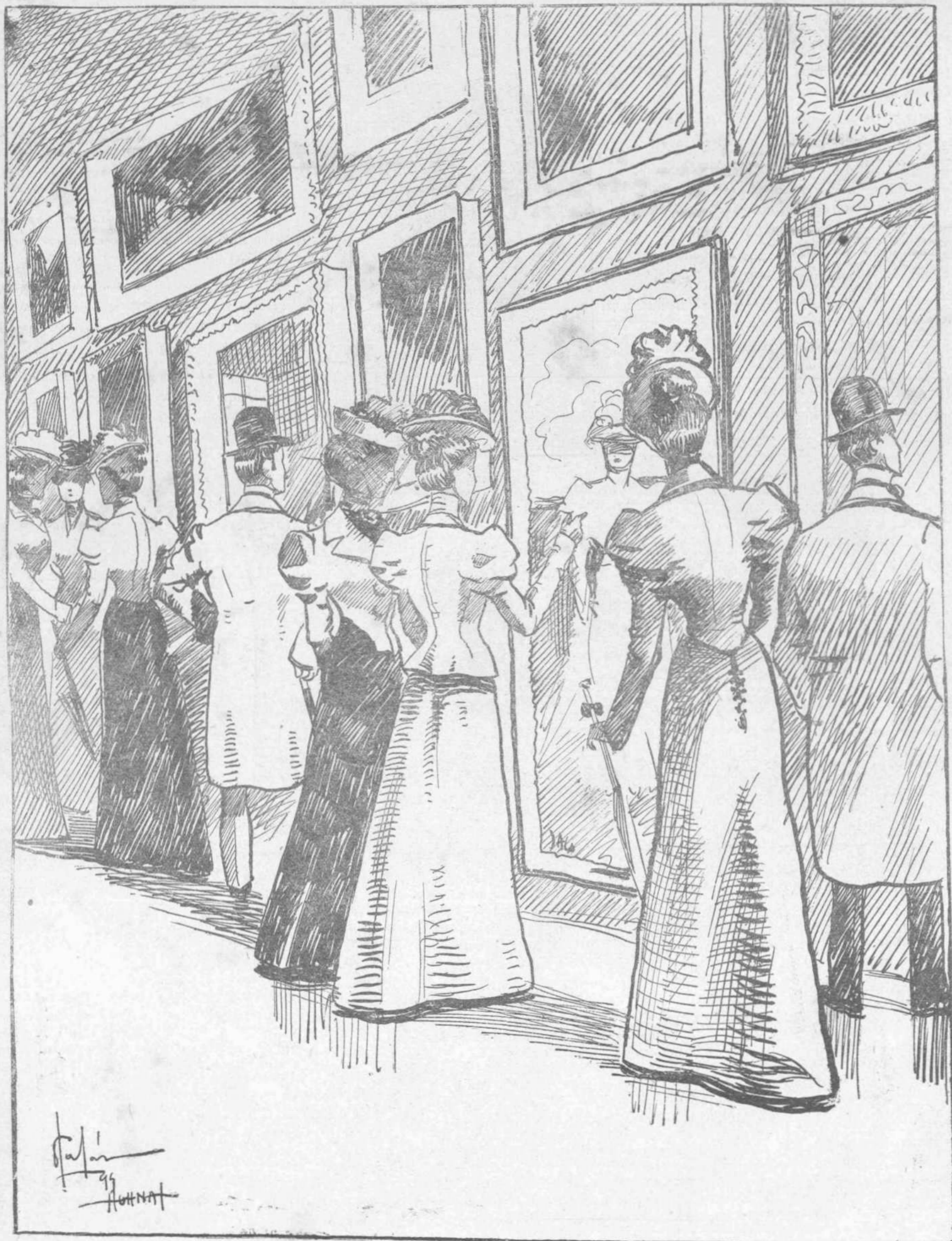
ΕΙΣ ΤΗΝ ΚΑΛΛΙΤΕΧΝΙΚΗΝ ΕΚΘΕΣΙΝ ΤΟΥ ΖΑΠΕΙΟΥ