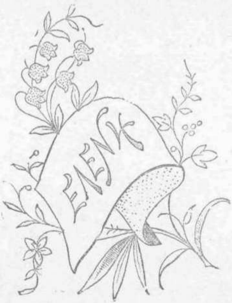
Κέντημα ἀνεβατὸν διὰ μιντῆλι