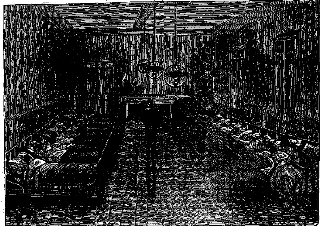
«Ο έπιτηρητής, που σουλατσάριζε επάνω και κάτω, στη μέση του θαλάμου...» (Σελ. 132, στ. γ')

και δέν θέλησαν να τόν βγάλουν από τήν πλάνη του. "Ετσι εξακολούθησαν να δείχνουν θαυμασμό και να βγάλουν έπιφωνήματα όσην ώρα έβάσταζε ή έπιθεώρηση. "Α! τί άμορφο που είν' αυτό! "Ω, τί έκτακτο που είναι εκείνο! Κι' ο Δουμποδάνος καμάρωνε κατευχαριστημένος. "Η άδυναμία του όμως, που δέν έδραπε κανένα, δέν τόν έμπόδιζε κιόλα να περιποιηται τούς φίλους του και να βρίσκη χιλίους τρόπους γιά να τούς διασκεδάση. "Ανάμεσα στέλλα με τήν άδεια πάντα των γονέων του, ένοίκιασε μία μέρα γαϊδουράκια γιά να πάνε γαϊδουροκαβαλλαρία. Θά