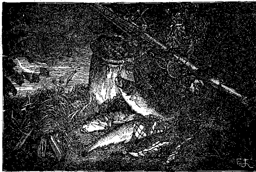
«Υπήρχε και κάποιο ποτάμι με ψάρια μεγάλα...» (Σελ. 176 στ. β').

νείς των φίλων τους το ύποσχεθηκαν. — Τι καλά! φώναξε ο Γεώργος. Όλοι μαζί! όλοι μαζί!