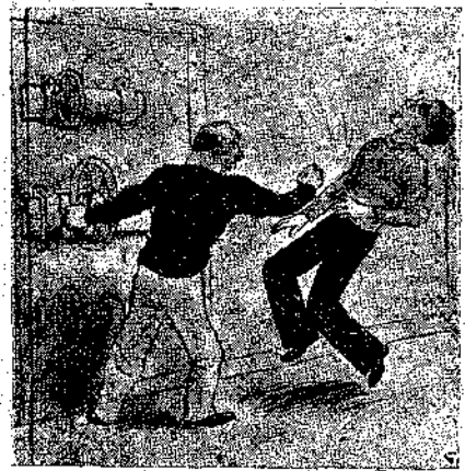
Ο Βαρνάβας έδωσε στον Έρρικο μία γεοδιά κατάστημα.

Τι λογής στρώματα είναι πάλι αυτά; Είναι μαλακά, τουλάχιστο; ΚΕΦΑΛΑΙΟΝ ΙΑ' Ο Άρης Οι δύο άερονάυτες τώρα δεν ξεκολλούν τα μάτια τους από τό ύψόμετρο που δείχνει άδιάκοπα σε ποία απόσταση, βρίσκονται από την επιφάνεια του πλανήτη: 30,000 χιλόμετρα, 29,000, 28,000, 27,000. Έπειδή ή εξέλιξη της βολίδας τους έμποδίζει έντελώς τη θέα, ο Έρρικος κόβει πότε-πότε τό γκάκι, και τότε δρμούν και οι τρεις προς τον φγγίτη άνοίγοντας τό μάτια τους διάπλατα για να ίδουν όσο τό δυνατόν καλύτερα τό παράξενα και πρωτογνωρίσια αυτά μέρη όπου δεν ξέρουν άκόμη τί τους περιμένει. Άπό έδω ψηλά άκόμη που βρίσκονται, μπορούν να κρίνουν πως τίποτε στον Άρη δεν μοιάζει με τη Γη. Ούτε θάλασσες, ούτε στεριές έχει ο πλανήτης. Οι θάλασσες μοιάζουν με άπέραντους ρηχούς βάλλτους και οι στεριές είναι όλες επίπεδες, με χαμηλούς λόφους μοναχά που έχουν άπαλές κινήσεις. Η βλάστηση άπλώνεται έδω κι' εκεί συγκεντρωμένη σε τετράγωνα επιφάνειες ή σε λουρίδες παράξενα στενές. Κι' οι τρεις άνθρωποι της Γης μένουν σιωπηλοί. Δεν λένε τίποτε, ούτε και σκέπτονται τίποτε. Ο Έρρικος άνοίγει πάλι τό γκάκι και τους περιστοιχίζει ξανά ή όμύχη. 26,000 χιλόμε. 25,500, 25,000, 24,000. Ο Άνδρέας κόβει πάλι τό γκάκι.