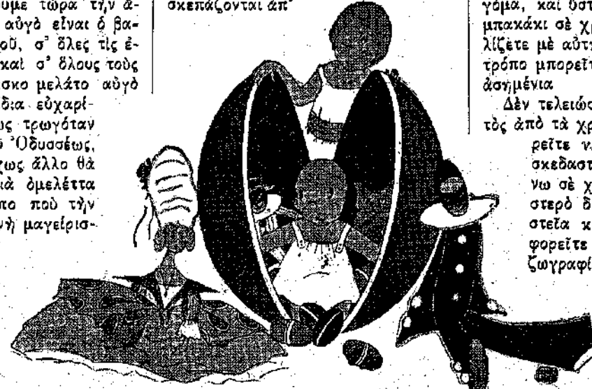
«Υπάρχουν και αυγά τόσο μεγάλα, ώστε χωρούν μέσα τους δλόκληρο Μπεμπέκο». (Σελ. 194, στ. β').

Μη νομίσετε πως τα ζαχαρωτά αυγά είναι γνωστά από τα πολύ παλιά χρόνια. Αυτά που τα πρωτόκανε είναι ένας Γάλλος ζαχαροπλάστης, ο Ραγκενό, που έζησε τον δέκατο όγδοο αιώνα. Αυτός το Πάσχα έβγαζε στη βιτρίνα του αυγά αληθινά, βαμμένα σε όλα τα χρώματα του ουρανού τόξου, που γίνονταν άναρπαστα. Κάποτε σκέφθηκε να κάνει ένα αυγό από καντιοζάχαρη κι' η επιτυχία του ήταν τόσο μεγάλη, ώστε δεν πρόφτανε να δέχεται παραγγελίες.