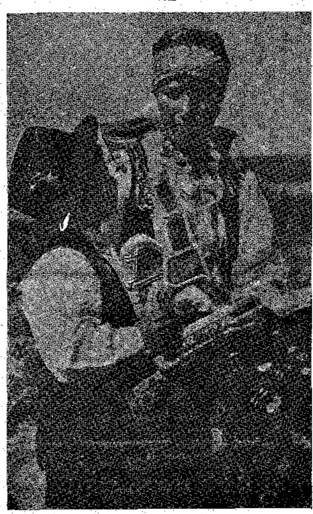
Στά χωριά τής Ούγγαρίας, τή Πάσχα και τίς άλλες μεγάλες γιορτές, χαρίζουν στή παιδιά από ένα χαχαρένιο άλογάκι. Είναι τή καθιερωμένο γιορτινό τους δώρο.