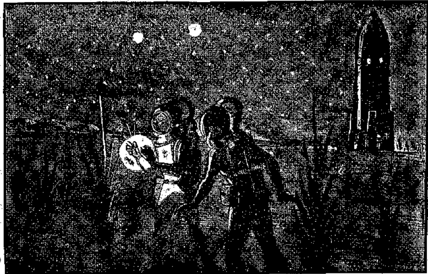
Ἡ βολίδα βρίσκεται σ' ἓνα μέρος ἔρημο. (Σελ. 203, στ. β').

Μὲ τὰ λόγια αὐτὰ ὁ Ἑρρίκος παίρνει στὰ χέρια του μιὰ γυάλινη σφαῖρα, ποὺ μ' ἓνα εἰδικὸ σύστημα ἀπὸ σωλήνες καὶ ἀντλίες θὰ