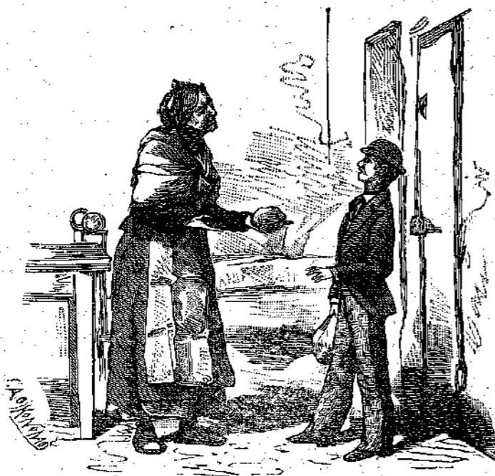
— Πάρ’ το, σου λέω, δικό σου είναι! (Σελ. 204, στ. α’)

“Όταν άφησαν πίσω τούς τή γραφικό σπιτάκι τού χωριού, πού τώρα φαινόταν άσπρο άνάμεσα σέ πρασινάδες, οι φίλοι ξαναρώτησαν τήν Μάριο νά τούς πη άληθινά πώς πέρασε τή νύχτα, κι’ αυτός τούς τή διηγήθηκε όλα: τή φόβο του, τήν πέτρα πού είχε πάρει γιά όπλο και πού τήν είχε ξεχάσει κάτω απ’ τή μαξιλάρι του, και τέλος τή ξόνημά του τή