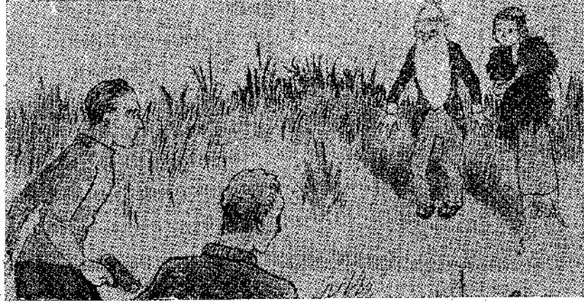
«Οἱ δύο Ἄρειοι μοιάζουν μὲ ἄνθρωπους, καὶ μάλιστα ὁ ἕνας μὲ ἄνδρα καὶ ἡ ἄλλη μὲ γυναῖκα» (Σελ. 217, στ. γ')

Βαρνάβα, αὐτοὶ εἶχαν μείνει ἀφανοὶ ἀπὸ τὴν ἐκπληξή τους.