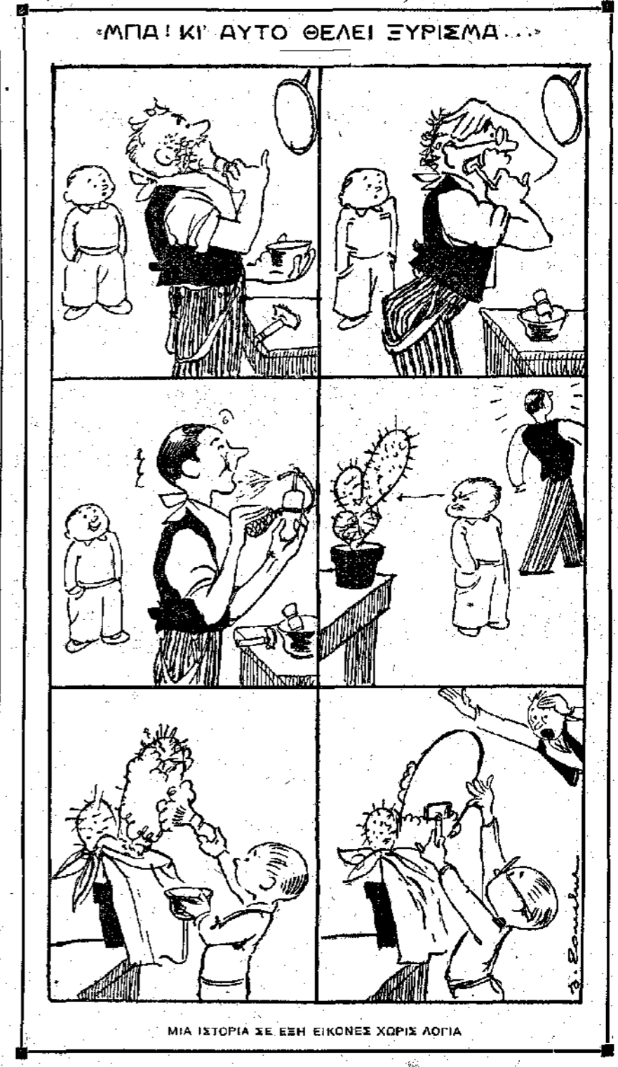
ΜΙΑ ΙΣΤΟΡΙΑ ΣΕ ΕΞΗ ΕΙΚΟΝΕΣ ΧΩΡΙΣ ΛΟΓΙΑ

Γιατρός, ἀπότομα. — Πᾶψε, παιδίκαδο, ποὺ θὰ μιλήσῃς. Ποῖς σου τὸν ἔμαθε αὐτὸ τὸν τρόπο ; Γιάννης, μὲ ἀπορία. — Πάλι δὲν εἴσατε εὐχαριστημένος ; Γιατρός, ἀπελπισμένος.— Θεέ μου, θὰ μὲ τρελλάνη... Γιάννης, (συγχρότως μὲ ἀπελπισία). — Χριστέ μου, θὰ μὲ τρελλάνη... ΑΥΓΛΑΙΑ