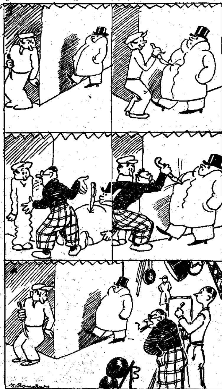
—Μπά! Γυρίζουν ταινία κινήματογράφου! Καὶ τὸ πήραμε γ' ἀληθινὰ καὶ τρομάξαμε τόσο!