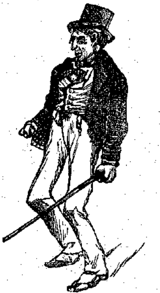
«— Πίσω, κλέφτες! . . . »

Ἔτσι γαϊδιὰ κι' ἔγγονούλα γλύτωσαν κι' ἦταν τώρα μαζί. Οἱ φίλοι μὰς ἤξεραν πῶς τὴν ἱστορία τους ὅλη κι' ἦταν πολὺ εὐχαριστήσιμοι ποὺ μπόρεσαν νὰ σῶσουν καὶ νὰ τὰ δυστυχημένα ἐκεῖνα πλάσματα. Ἐβλεπαν ὅμως πῶς εἶχαν χάσει κι' ἐκείνη τὴν ἡμέρα, κι' ἀποφάσισαν νὰ