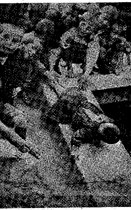
Φυσικὴ τσελλήθρα Ἀνεκρινθή ἀπὸ τὸ Μύρον τῆς Ἀνδρου

Εἶχαν ὅλοι τους γυρῆσει στὴ βολίδα. Εἶχαν ἐξετάσει τὰ ὄργανα, εἶχαν ἐπιθεωρήσει τὰ ντεπόζιτα μὲ τὴν καυσίμη ὕλη. Ὅλα ἦσαν ἐν τάξει, ἔτοιμα γιὰ τὴν ἀναχώρηση. Κανένας δὲν ὀπισθιάζον τὴν τοῦ Ἐρρίκου.