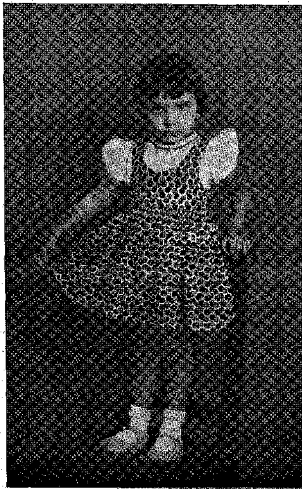
— Πῶς σὰς φαίνεται τὸ καινούργιον μου φόρεμα ; Ἐμένα δὲν μ' ἐνθουσιάζει. . .

Ἀνεκρινώδη ἀπὸ τὴν Πριγκίπισσαν τῶν Παρισίων