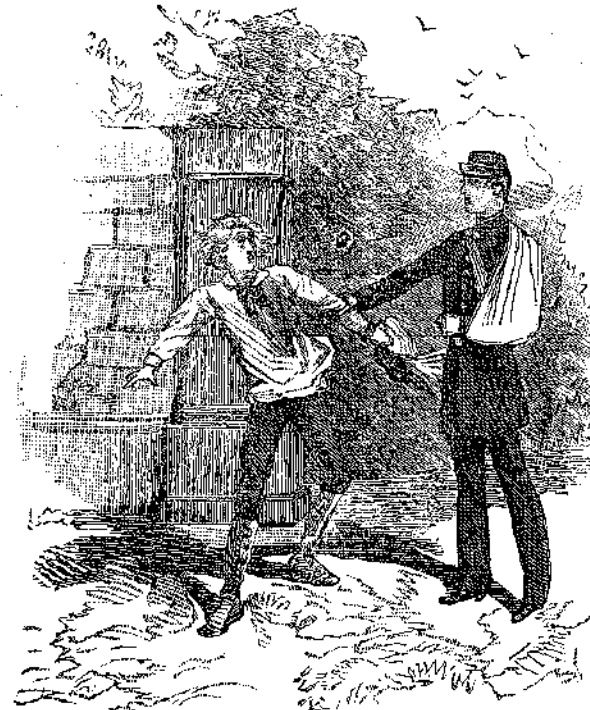
— Άσε με και κυνηγώ τώρα κάποιον! ..