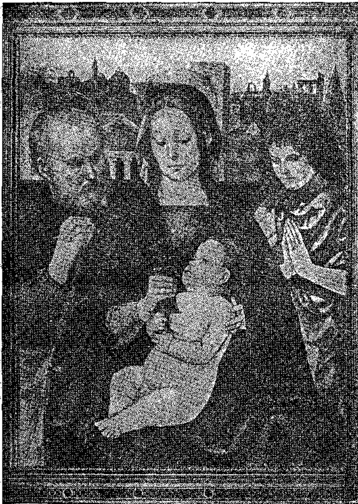
Μία θαυμάσια εἰκόνα τοῦ καλλιῶ καὶ περιφημοῦ ἰταλοῦ ζωγράφου Πιντουρικόκιου (Pinturicchio)