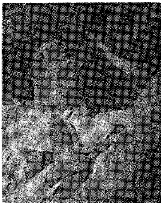
Το πρώτο της Πρωτοχρονιάς, το παιδί που το είδατε στο προηγούμενο φύλλο να κοιμάται, ξύπνησε.

να πάνε να επισκεφθούν τον μεγάλο έφημο μέσα στο σιδερένιο του κουτί. Κι' όταν έφθασε στο βαπόρι με όλους τους δημοσιογράφους στο έρημονησο, δεν υπήρχε πια εκεί ούτε ο γερο-τραλλός, ούτε το μηχανήμά του ούτε τίποτε. Δεν ξέρουμε αν ο μουρλομαθηματικός αυτός θέλησε να κινή κανένα δοκιμαστικό πείραμα ή τίποτε παρόμοιο, μ' ή αλήθεια είναι πως κι' αυτός και η βολίδα του τινάχτηκαν στον άερα και πως από τότε έγινε άφαντος γιατί κανένας δεν είχε την διάθεση να πάη να τον φερθή στον πάτο της θάλασσας όπου θα βρισκται ακόμη και θά μπορούσε.