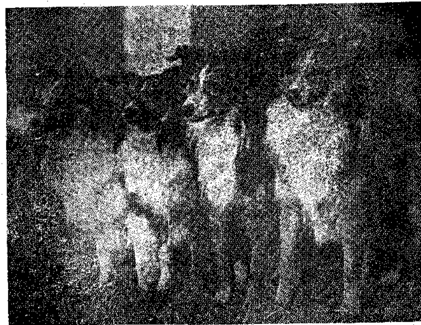
Τέσσαρα ωραιότατα βραβευμένα ακυλία