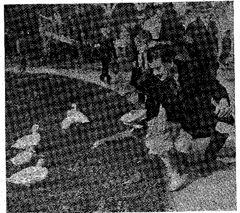
"Η μικρή αυτή Παριζιάνα μ'ε τ'ο μπαμπά της νάζει τις χ'ίνες ενός πάρκου σ'ο Παρίσι.