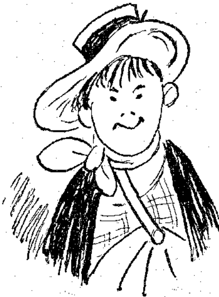
Ὁ Κώκλμπερν Φίνν, ὁ νεαρὸς παρίας τοῦ χωριοῦ...

ἔξω κι' ἀπὸ μέσα, ἀλλὰ δὲν ἀνακάλυψε καμμιά; οὔτε τὴν παραμικρὴ ἐνόχληση. Συναεξετάσθηκε ἄλλη μιά φορὰ καὶ τώρα τοῦ φάνηκε πὼς ἀνακάλυψε μιά ἐλάχιστη ὑποψία κωλικόπονου ποῦ γεμάτος ἐλπίδα ἀρχισε