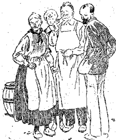
"Ήρθε να ιδή πόσα λεφτά κού' βεις εις γελώντας ό πεταλωτής."

λιάδες, ξέρω γώ πόσα : μά και με τούτα άκόμη που είχαν πάρει δέν τους άφηναν ήσυχους και όλο τους φοβέριζαν και γι' αυτό πήραν την άπόφαση να διώξουν τό κορίτσι τους από την "Αμερική. Έγώ λοιπόν δέν είχα παρά να την πάρω μαζί μου και να την φέρω στην Εδρώπη και να κάνω όλον τον κόσμο να πιστέψη πώς είναι άνιψιά μου.