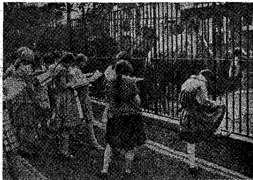
Γερμανίδες μαθήτριες ζωγραφίζουν ζωὰ ἐκ τοῦ φυσικοῦ ὁ ἓνα Ζωολογικὸ Κῆπο τοῦ Βερολίνου