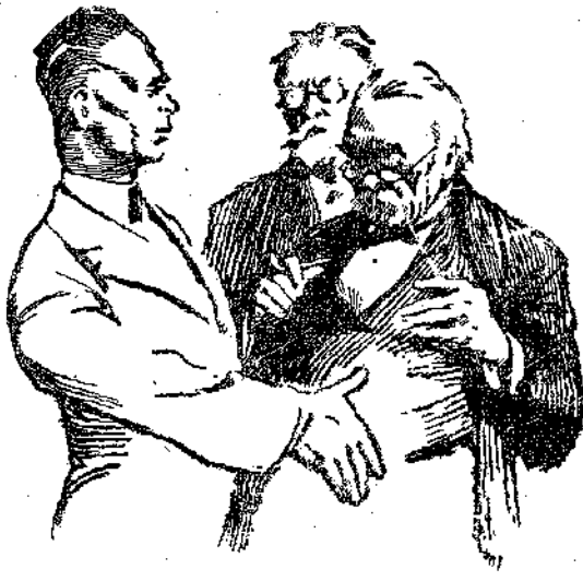
—Σύμφωνοι λοιπόν! εἶπε ὁ Ἀμερικανὸς ἀπλώνοντας τὸ χέρι του...

Πήδησαν σ' ἓνα ταῖλι κι' ἐφυγαν γρήγορα μὴπως τοὺς ἀναγνώριζε κανεὶς καὶ τοὺς παρακολουθοῦσε. Ὁ Νταρλιέ ὠδήγησε τοὺς δύο νέους στὸ σπίτι του καὶ τὰ τρία αὐτὰ πλάσματα ποὺ τὰ ἔνωγε μιὰ κοινὴ χαρὰ, πέρασαν τὴ βραδυὰ τοὺς ἡσυχὰ κι' εὐχάριστα σὺν μιὰ οἰκογένεια.