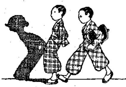
Κάτω οι τσέπες! φώναξε ο Άγγλος ύπουργός...

Σήμερα θα σας πάρω να κάνουμε μαζί, ένα γύρω στους λαχανόκηπους. Μά επειδή ξέρετε πως δεν σας δείχνω ποτέ, τίποτε συνηθισμένο, ο γύρος μας θα είναι εξαιρετικός και σε λαχανόκηπους εξαιρετικούς. "Ας επισκεφθούμε πρώτα το λαχανόκηπο του κ. Μπασλέν στο Μονφωκόν της Γαλλίας. "Εκει, μαζί με άλλα σπάνια λαχανικά θα ιδούμε κι' ένα κα-