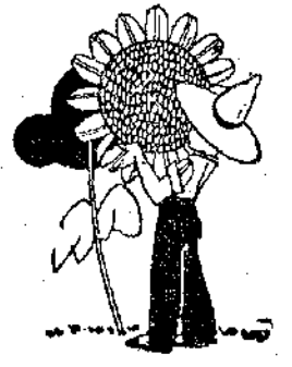
"Ένας ήλιος σαν τον αληθινό..."

"Ολοι σας διαβάσετε και με πόσο ενδιαφέρον, το συναρπαστικό καινούργιο μας μυθιστόρημα: «Όταν άνα-