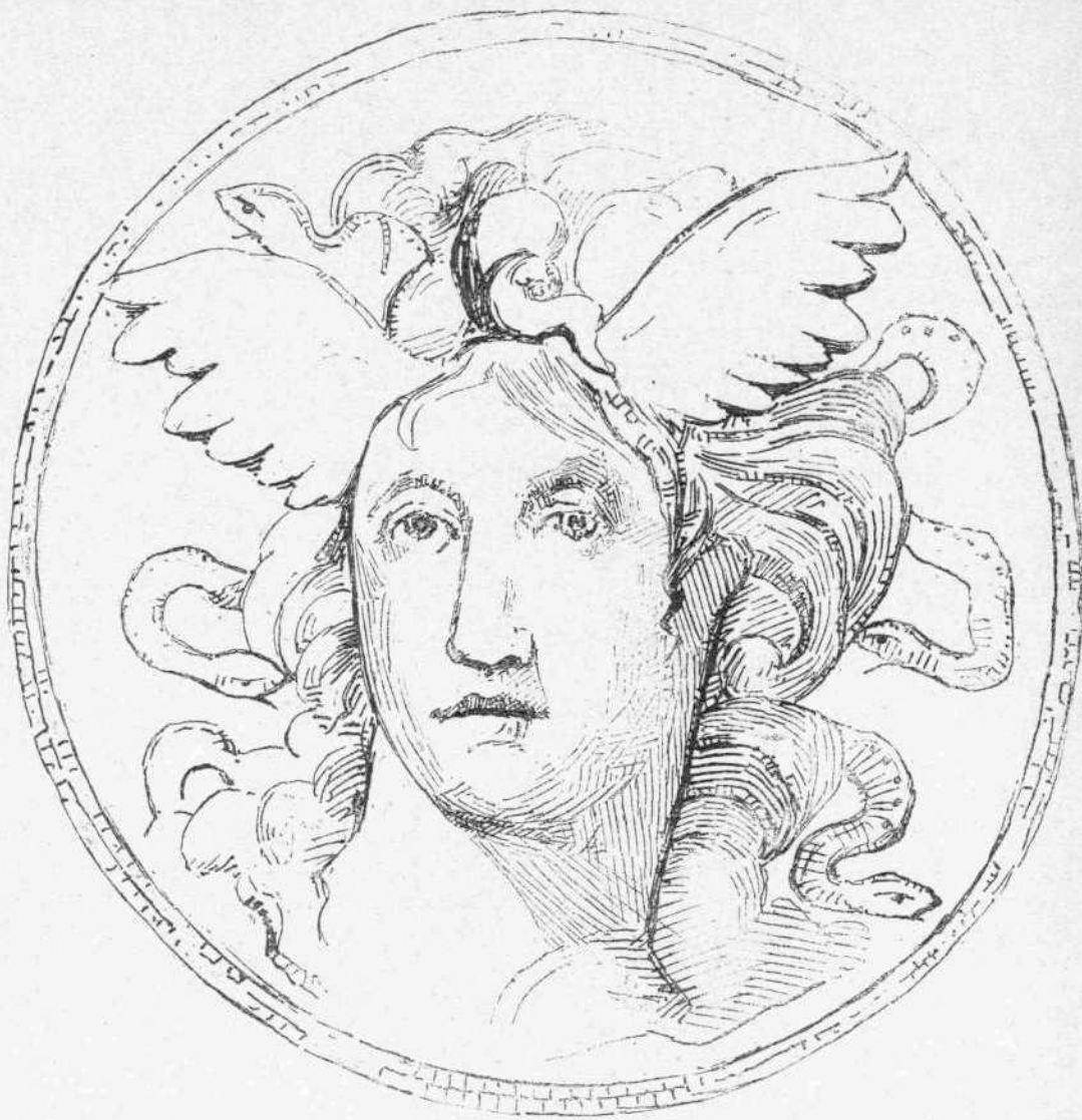
Ἡ ΚΕΦΑΛΗ ΤΗΣ ΜΕΔΟΥΣΗΣ

πάνοπτον, νὰ τοῦ δώσῃ οἰανδήποτε στάσιν, νὰ τὸν εἰσαγάγῃ εἰς οἰανδήποτε παράστασιν, ἐν μέσῳ τῶν χειροκροτημάτων τοῦ πλήθους καὶ τῶν γελώτων εἰς βάρος τοῦ δυστυχοῦς αὐτοῦ, τοῦ ὑ-