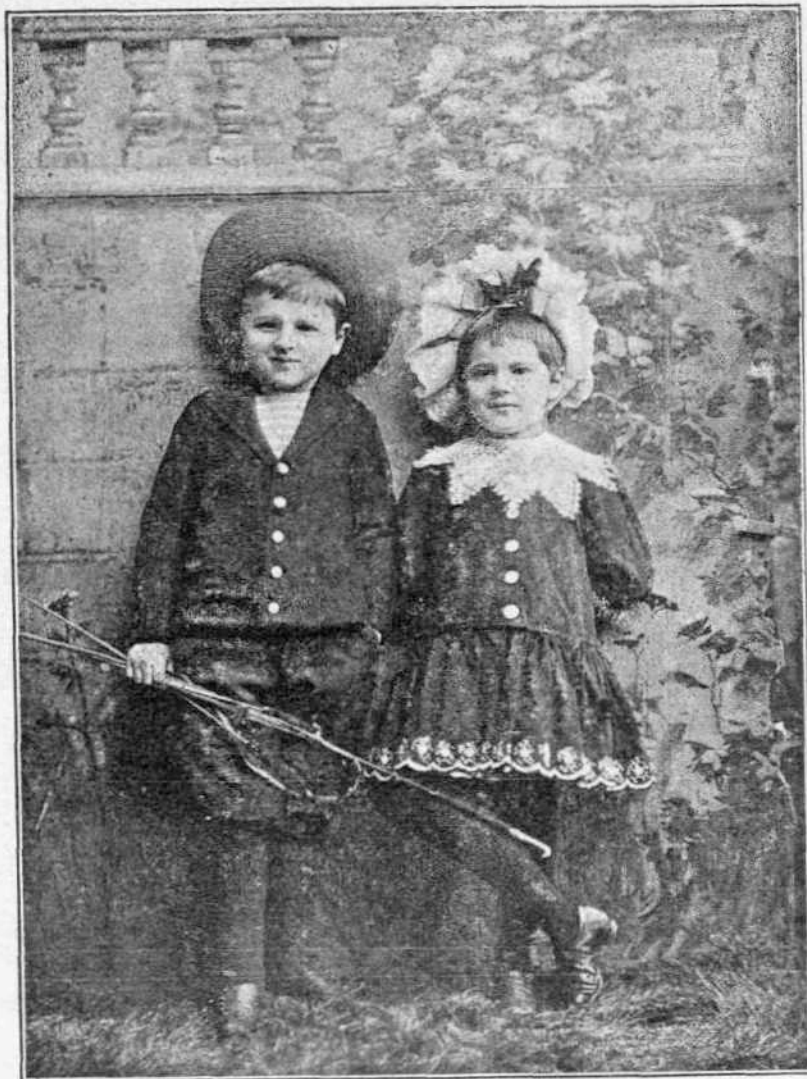
ΑΔΕΛΦΟΣ ΚΑΙ ΑΔΕΛΦΗ

Διά τούτο την πρώτην αυτήν Μαίου, καθ' ήν κλεισμένος εις την οικίαν στενοχωρούμαι ότι δέν έχάρην την έορτήν των 'Ανθίων, και βλέπω από του