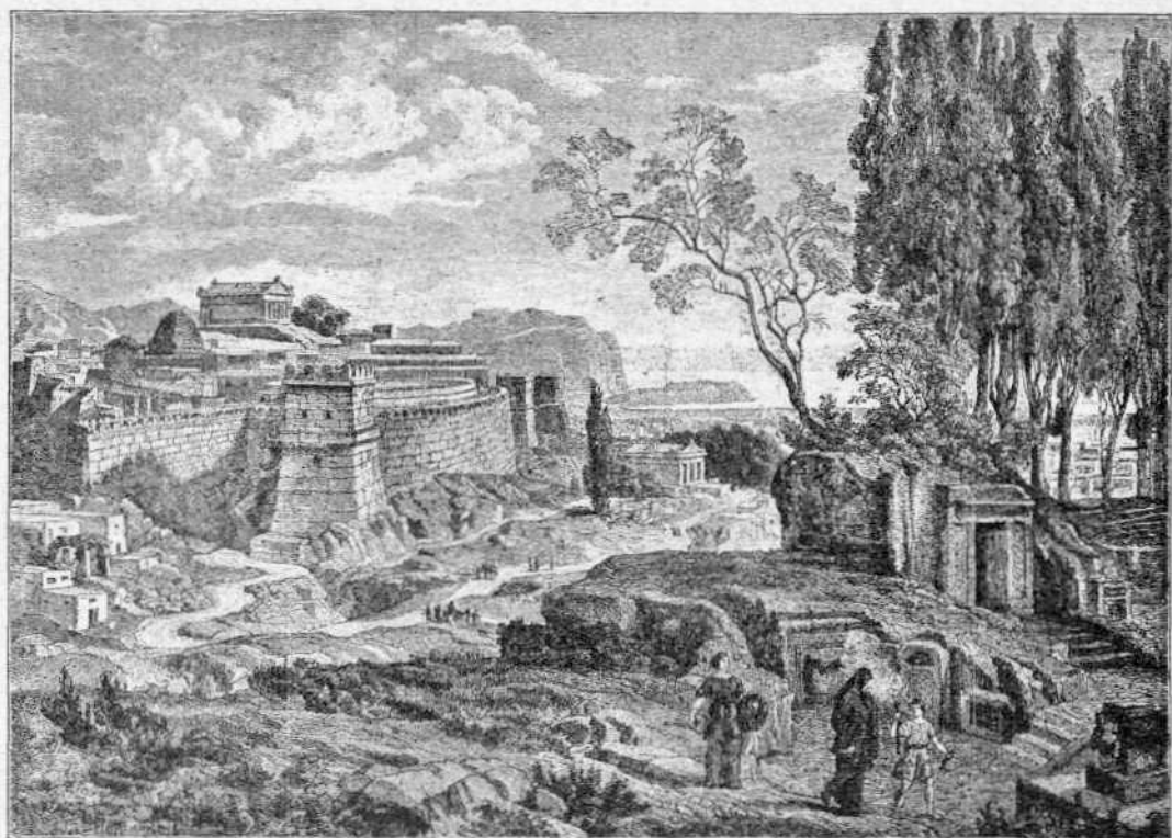
ΑΙ ΜΥΚΗΝΑΙ ΕΠΙ ΤΩΝ ΑΤΡΕΙΔΩΝ

της δουλείας του από μ.ο.υ — είναι ο κύριος της τοιαύτης μεταβολής έχθρος. Δεν ήξεύρομεν βεβαίως ποίον των διαφόρων τούτων συστημάτων είναι αληθές απόλυτως και υπέρ τίνος όφειλομεν νά αγωνισθώμεν. 'Αλλ' ό,τι δι' ήμās είναι αναμφισβήτητον είναι ότι από του εύγενοϋς, του έπιστημονικου, του όλως θεωρητικου σοσιαλισμου — και αυτός φαίνεται ότι παρ' ήμίν άγνοείται έντελώς — μέχρι της υπό των άγυρτών και δημαγωγών εκμεταλλεύσεως του, του σοσιαλισμου των καφετειών και των όδών, του άπαισιου και βιαίου, του πεπλανημένου και άμαθους, του μαινομένου υπό μυριάς μορφάς, ή άπόστασις είναι άδυσσος, ή όποία διά νά πληρωθ ή θα χρειασθώσιν έτη πολλά, αιώνας ίσως όλόκληρος ενεργείας, έως ού καταλήξ η εις συγκεκριμένην τινά μεταβολήν, της όποίας μόνον ή τάσις ήρχισε νά παρατηρηται. Σήμερον οι κεφαλαιούχοι, εκ συμφέροντος άμέσου άτομικου, είναι οι φυσικοί έχθροι της σοσιαλιστικής θεωρίας. 'Ο λαός άπεναντίας, πρό πάντων ό πάσχων λαός των εύρωπαϊκών μεγαλόπολεων, διάκειται όρμηφύτως υπέρ αυτής και εναντίον των κεφαλαιούχων' έξερειζόμενος δε καταλλήλως υπό λόγων, δημοσιευμάτων και παραδειγμάτων, εκπρέπεται υπό μυρία προσχήματα εις έχθρικάς κατ' εκείνων εκδηλώσεις. Ταύτας ή Κυβέρνησις, ή αναγκάως συντηρητική, προσπαθεί δι' όλων της τών μέσων νά καταπνίξ η. Είναι δε φυσικόν ή αντίδρασις αυτή νά επιφέρ η όλοέν μεγαλειότεραν όξύτητα και νά επαπειλήται ή τάξις και νά κορυφουται ό φόδος την ήμέραν των εργατικών συγκεντρώσεων. Αυτή είναι ή θέσις της 1ης Μαίου, της διεθνούς σοσιαλι-