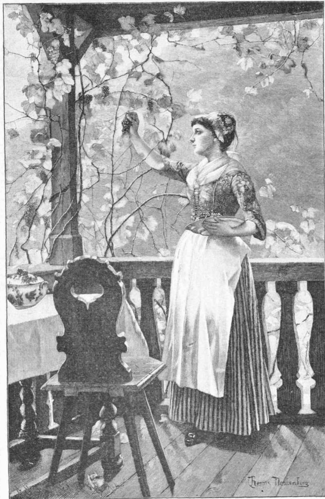
«Γιὰ τὸ τραπέζι».