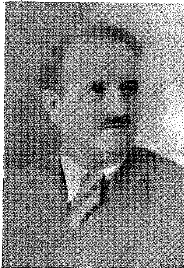
Ο Κ. Κ. Γ. ΚΟΤΖΙΑΣ ΥΠΟΥΡΓΟΣ ΔΙΟΙΚΗΤΗΣ ΠΡΩΤΕΥΟΥΣΗΣ

Βαθύτατα συγκινημένος, ἀλλὰ καὶ γεμῆτος χαρᾶς ποὺ ἔνα παλιὸ Διαπλασάπουλο, ἀπὸ τὰ κατέχοντα σήμερον τόσο μεγάλη θέσιν, προσφε- ρέταν νὰ κάμῃ καὶ καλὸ γιὰ τὴν «Διάπλασιν» — ποὺ ἄλλα δὲν τὸ σκέφθηκαν ὡς τώρα — ὁ κ. Παπαδόπουλος ἔσπευσε νὰπαντήσῃ ἐκτενῶς στὸν κ. Κοτζιά. Στὸ γράμ- μα τοῦ μαζὶ μὲ τὴν θερμὴν