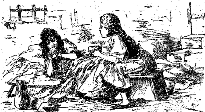
«Πιές το, είναι καλό, είπε ή 'Εμορφία...»

ή καρδιά μου. Μά πάλι, νά τό φέρω έξω, έτσι πονηρό που είναι δέν ξέρει κανείς τί μπορεί νά γίνη. Αν είχα τουλάχιστον κανένα σκέπασμα ζεστό νά τό τυλιξω; μά τό κλειδί τό έχει ή μητέρα και πρέπει νά την ξυπνήσω και νά της εξηγήσω όλη την ό-