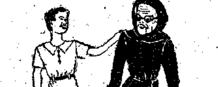
ΕΙΚΟΝΟΓΡΑΦΗΜΕΝΟΝ ΠΑΙΔΙΚΟΝ ΠΝΕΥΜΑ