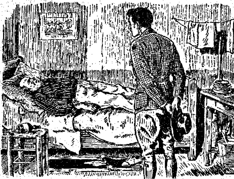
Δὲν ὑπῆρχε ἀμφιβολία πῶς τὸ ἀεισητήρητο αὐτὸ ὑποκείμενον ἦταν ὁ προϊστάμενός μου. (Σελ. 90, σελ. α')

Ἦστερα ἀπὸ μιὰ μακρότατη καὶ κουραστικὴ διαδρομὴ μὲ τὸ σιδηρό- δρομον, ποὺ τὴν ἐπακολούθησε ἕνα ἐ- ξαντητικὸ ταξίδι μὲ τὸ ἀμάξι ἀνάμε- σα ἀπὸ ἀγροὺς πεδιάδες καὶ ἀπὸ χα-