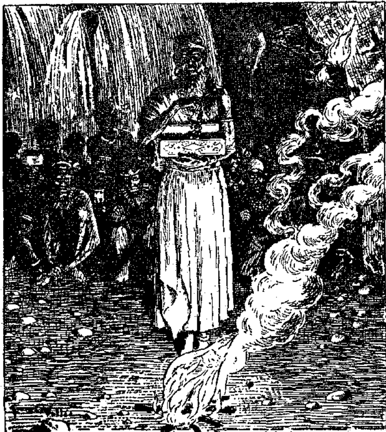
«Ἐνας κατασφάκτης ἀπὸ κόκκινες πέτρες ἀστραφὲς στὰ χέρια του...»

Κάτω ἀπὸ τὸ φῶς τοῦ φαναριοῦ ποὺ ἔμπαινε ἀπὸ μιὰ χαραμάδα τῆς πόρτας ἔχαραξα βιαστικὰ στὸ σημειωματάριό μου ἓνα σημεῖωμα γιὰ τὸν Ἀρκόλλ. Τοῦ ἔγραψα γιὰ τὰ σχέδια ποὺ εἶχα ἀκούσει καὶ ἀνέφερα ξεχωριστὰ τὸ πέρασμα τοῦ Ντευπρὴ στὸν Λεταμπά. Τοῦ πρόθεσα πῶς πῆγαίνα στὸ Ρόβραντ γιὰ νὰ νανακαλύψω τὸ μυστικὸ τῆς σπηλιάς καὶ στὸ τέλος παρακάλεσα τὸν Ἀρκόλλ