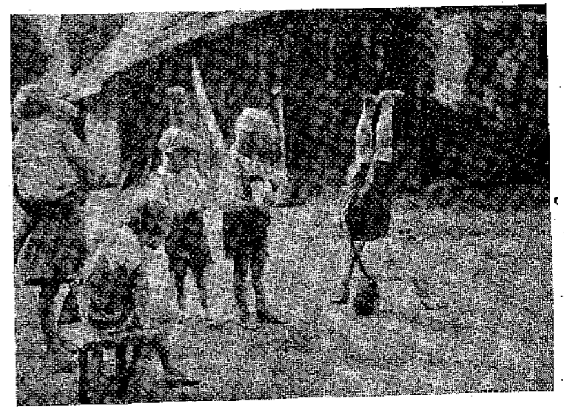
Ο Τάκης κάνει τόν «κόκκορο». Άνεκρινόθη από τδ Ζουλάκι