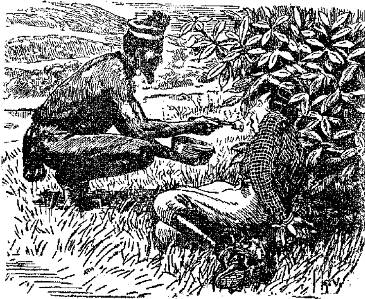
«Χρησιμοποίησε για κουτάλι το μαχαίρι του κι' άρχισε να με ταΐζει...»

Τό φώς και οι κα- πνοί των δαυλιών, ή μο- νότονος κρότος του νε- ρού που έπεφτε, ή σιω- πή που βασιλευε στη σπηλιά και ή κούραση που έννοιωθα, όλα αυτά έκαναν βαρύ το κεφάλι μου. "Ένοιωθα τὰ μά- τια μου να κλείνουν και τον ύπνο να με κυριεύη.