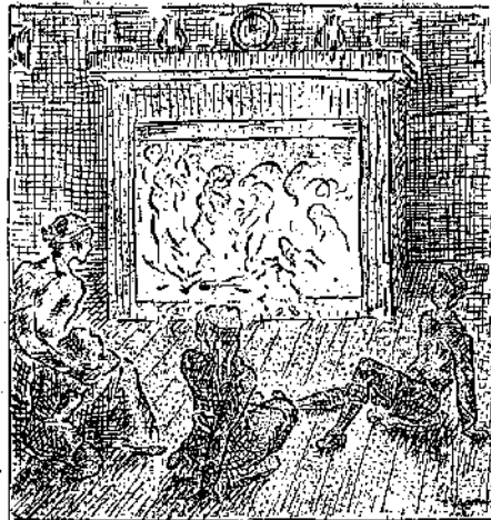
Χριστουγεννιάτικο δράμα. [Σκίτσος του "Αρπη"]

στέκονται άκούνητες για να μνή τον τρομάξο και φύγη. Κι' εκεί κοντά στο ρουαάκι σουσουράδες, άλλες μ' απλό άσπρο φάσμα κι' άλλες με κίτρινο, περπατούν πηδηχτά πάνω-κάτω, κουρώντας τις σφίδες τους.