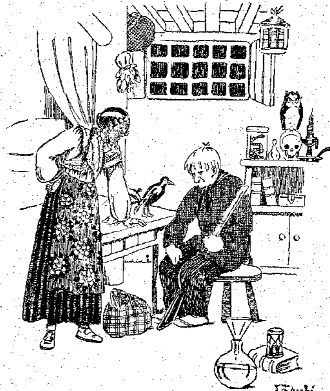
Φοβισμένος ακόμη ο Ξορκιάς διηγήθηκε στή γυναίκα του τά περισσότερα τής ημέρας...

—Χαχά, γελάσανε κοροϊδευτικά οι χωριάτες. Στή φαμελιά της πάει. Έχει κάτι γύφτους σαν κι' εσάς