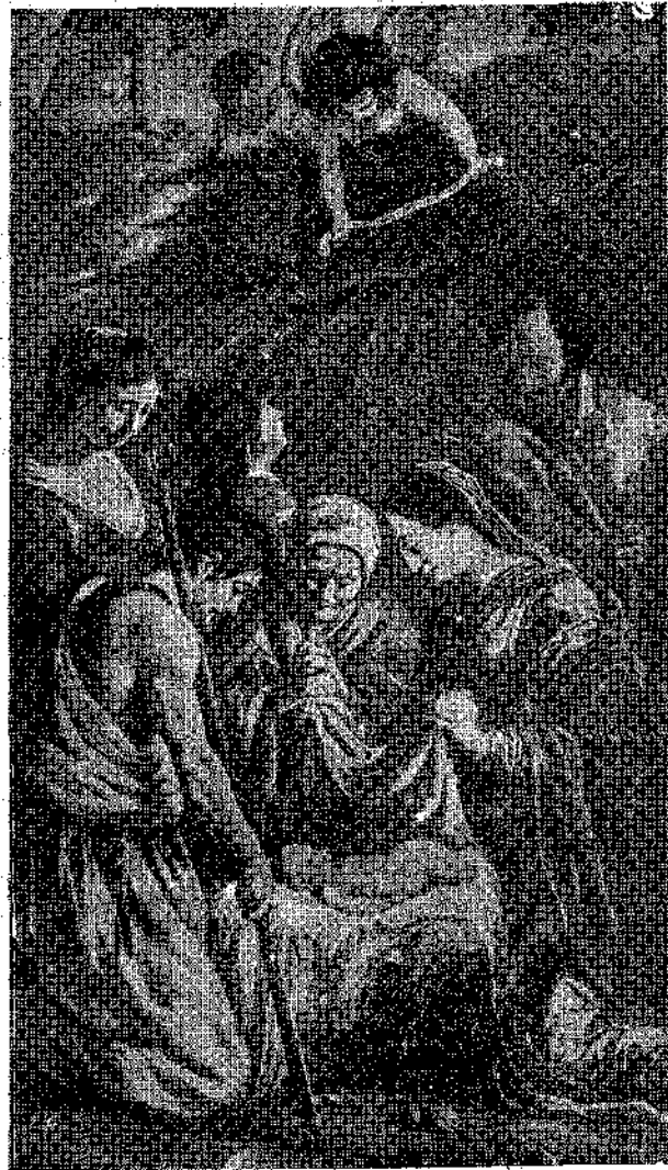
«Ἄγγελος μετὰ παιμένον δοξολογοῦσι...» Εἰκόνα τοῦ γάλλου ζωγράφου ΑΕΝΑΙΝ (ΙΖ' αἰῶνας)