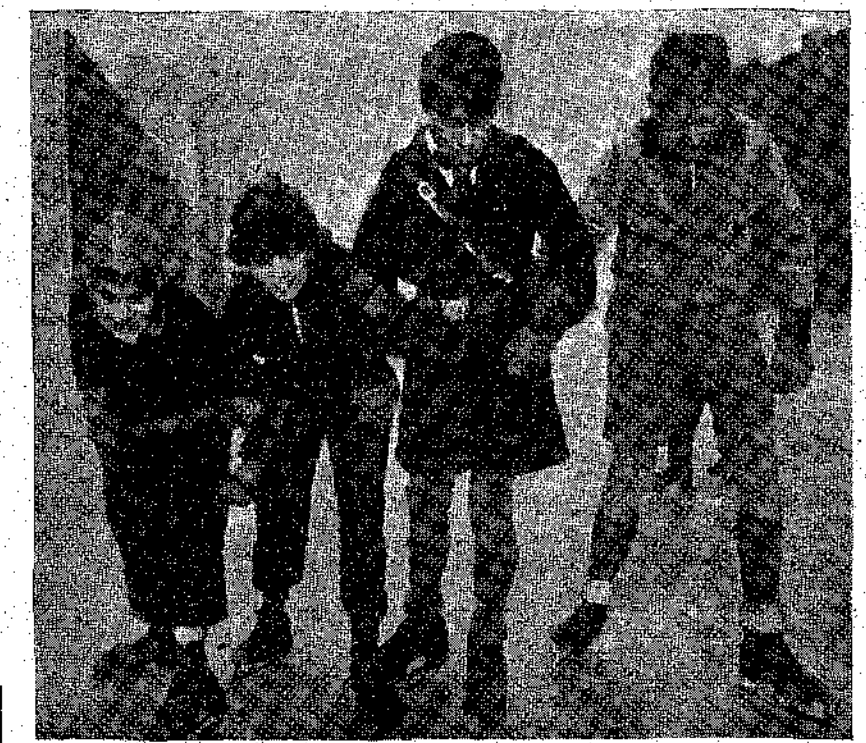
Παιδιὰ τῆς Σουηδίας μὲ παγοπέδιλα κάνουν τὰ πρῶτα βήματα ἀπάνω στὸν πάγο.