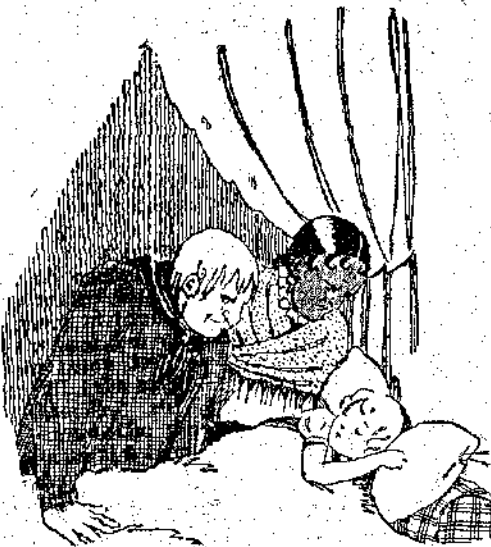
«Παραμιλάει! εἶπε ὁ Σορκιάς...»

τὸ τὸ μέρος καί τώρα ἐξακολουθοῦ- σε νὰ ρίχνῃ τὰ χαρτιά, νὰ λέγῃ τὴν μοῖρα καί νὰ πουλᾷ κάθε λογιῆς μαντζούνια καί μαγικά στοὺς ἀφελεῖς χωριάτες ποῦ κοροῖδευε. Πότε-πότε χανόταν, χωρὶς κανεὶς νὰ τὴν ἴδῃ, οὔτε πότε ἔφηνε, οὔτε πότε γύριζε. Πήγαινε κι' ἔδλεπε τὸ συγγενολό- γι, κάτι ἄλλους ἀποίγγανους ποῦ ἦταν σκορπισμένοι ἐστὴν περιφέρεια ἕνα γόρο καί ποῦ τῆς ἐμπιστεύονταν μερικὰ ἀπὸ τὰ κλοπιμαῖα τους, ἐκεῖ- να ποῦ ἦταν κάπως ποῦ ἐπικίνδυ- νο νὰ τὰ κρατήσουν οἱ ἴδιοι. "Ἀπόψε ὅμως εἶχε γυρίσει ποῦ κακόκεφῃ. Φαινόταν κατακουρασμέ- νη κι' ὅταν τελείωσε ὁ ἀνδρας τῆς τὴν ἀφήγησέ του, ἀπάντησε νευριασμένη: — Νὰ δᾶ ἡ ὦρα νὰ ἔχουμε μπλε- ξίματα καί μὲ τοὺς χωροφύλακες. Θὰ προφτάσω τουλάχιστον νὰ κρῶ-