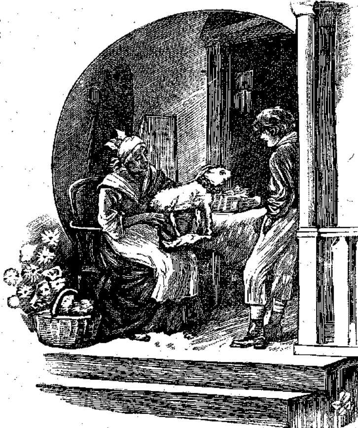
«Δὲν εἶναι σὰν ἀληθινό;...»

— Ὁ κύριος ἔχει δίκιο, εἶπε ἡ Κελίνα. Ἄκουσες τί σοῦ εἶπε; Θὰ σὲ πληρώνῃ κάθε φορά κι' ἔτσι ὁ καίμενος ὁ πατέρας σου θάχῃ πε-